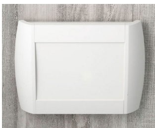
A9094107 DIATEC M ABS (UL 94 HB) off-white RAL 9002 270x48x200mm IP 40