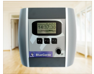
House control unit