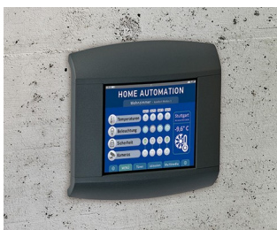
Control panel for home automation

Periferiche di computer e informatica, IoT/IIoT, sistemi di rilevamento dati sul posto di lavoro, impianti di intercomunicazione e di monitoraggio, dispositivi per il controllo dell'accesso, metrologia, tecnica di regolazione, tecnica medica e di laboratorio, ecc.