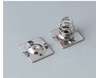
A9190015 Set of battery clips, 2 x AA Steel nickel-plated