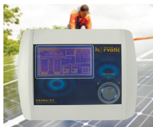
Control unit for photovoltaic solar installations