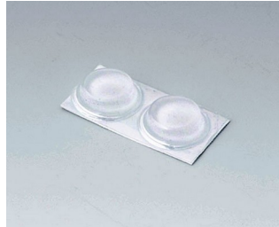
A9212330 Anti-slide feet 12 x 3.5 mm transparent

Salvo modifiche tecniche. © OKW Gehäusesysteme, Buchen/Germania.