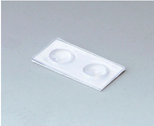
A9207150 Anti-slide feet 6.5 x 2 mm transparent