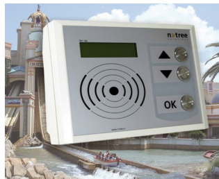
Versatile terminal for leisure facilities