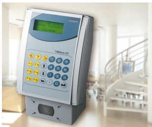
Terminal for time recording, access control and order management