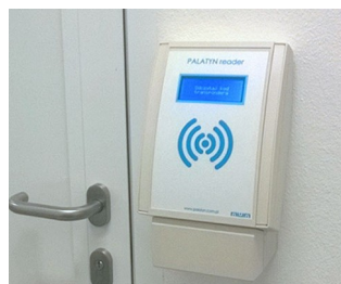
RFID access control readers