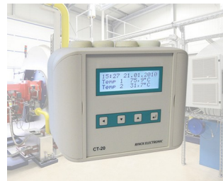
Universal temperature controller / Temperature difference controller