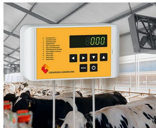
Agricultural climate Control