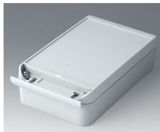
C6013221 SMART-BOX WIDTH 130 ASA+PC (UL 94 V-0) light grey RAL 7035 220x130x60mm IP 66