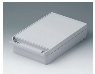
C6017281 SMART-BOX WIDTH 170 ASA+PC (UL 94 V-0) light grey RAL 7035 280x170x60mm IP 65