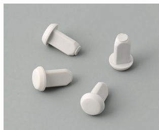
C2299018 Case feet TPE (UL 94 HB)

Salvo modifiche tecniche.