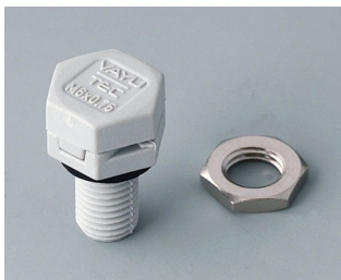
C2306917 Pressure equalisation element M6x0.75 PA 6 (UL 94 HB) light grey RAL 7035 IP 56