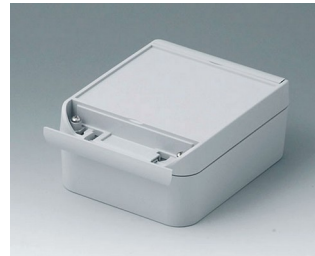
C6011141 SMART-BOX WIDTH 110 ASA+PC (UL 94 V-0) light grey RAL 7035 140x110x60mm IP 66