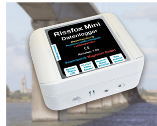
Miniature data logger for crack displacements and climatic data