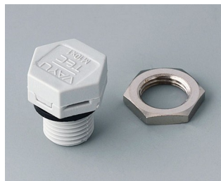
C2310917 Pressure equalisation element M10x1 PA 6 (UL 94 HB) light grey RAL 7035 IP 56