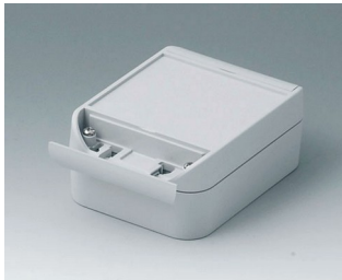
C6009121 SMART-BOX WIDTH 90 ASA+PC (UL 94 V-0) light grey RAL 7035 120x90x50mm IP 66