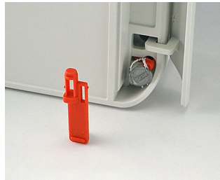
C6100006 Security plug PA 6 red