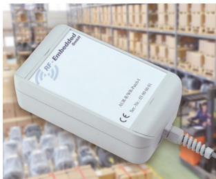
Active UHF RFID system

Predestinati per applicazioni elettriche ed elettroniche orientate al design, ad es. tecnica di riscaldamento, condizionamento e ventilazione, sistemi di controllo e di impianti, sistemi di sicurezza, IoT/IloT, smart factory, industrie 4.0, ecc.