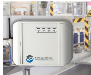
Data logger for machine monitoring