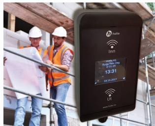
RFID card reader for construction site workers