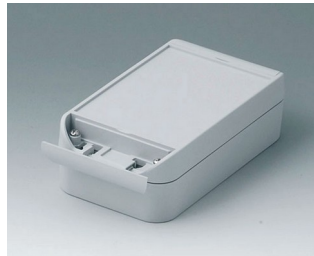
C6009161 SMART-BOX WIDTH 90 ASA+PC (UL 94 V-0) light grey RAL 7035 160x90x50mm IP 66