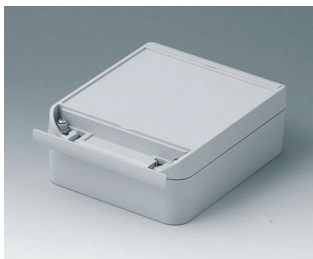
C6013161 SMART-BOX WIDTH 130 ASA+PC (UL 94 V-0) light grey RAL 7035 160x130x60mm IP 66