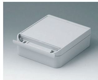
C6015181 SMART-BOX WIDTH 150 ASA+PC (UL 94 V-0) light grey RAL 7035 180x150x60mm IP 66