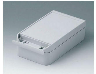
C6011201 SMART-BOX WIDTH 110 ASA+PC (UL 94 V-0) light grey RAL 7035 200x110x60mm IP 66