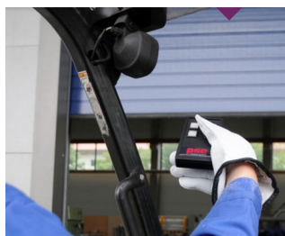
IR remote control for harsh environments

Ideale per generatori e ricevitori di impulsi, metrologia e tecnologia di regolazione, generatori di impulsi per ultrasuoni e raggi infrarossi, svariate tipologie di comandi a distanza, comunicazione senza fili, rilevamento mobile di dati, ecc.