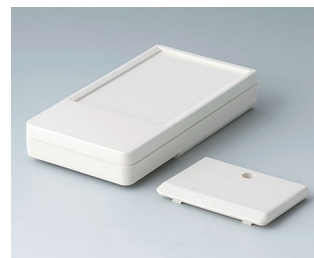
A9072117 DATEC-POCKET-BOX L ABS (UL 94 HB) off-white RAL 9002 120x65x22mm IP 54