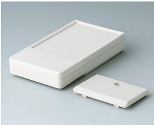
A9071117 DATEC-POCKET-BOX M ABS (UL 94 HB) off-white RAL 9002 105x58x18,5mm IP 54