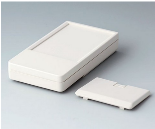
A9072127 DATEC-POCKET-BOX L ABS (UL 94 HB) off-white RAL 9002 120x65x22mm IP 41