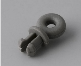
A9100001 Ring eyelet PA 6 volcano