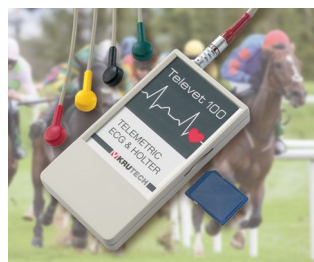
Telemetric ECG system for veterinary medicine