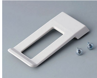
A9172107 Belt/Pocket clip ABS (UL 94 HB) off-white RAL 9002 62x30mm