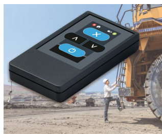
Radio transmitter for machines