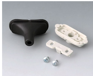
B2911319 Cable gland kit, 4.2 - 5.0 TPE black RAL 9005