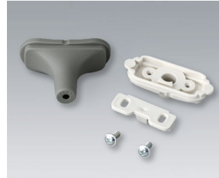
B2911308 Cable gland kit, 3.4 - 4.2 TPE volcano