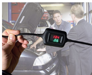
Voltage and current display during trickle charging