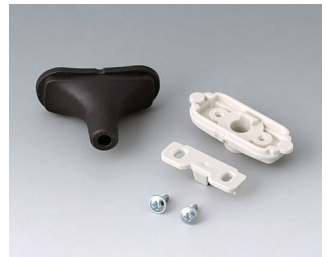
B2911329 Cable gland kit, 5.0 - 5.9 TPE black RAL 9005