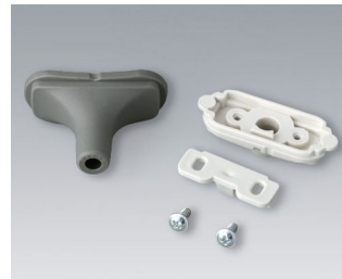
B2911328 Cable gland kit, 5.0 - 5.9 TPE volcano