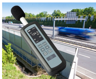
Noise level measurement