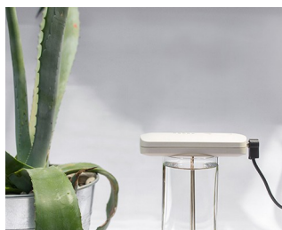
Tool for making colloidal silver solutions