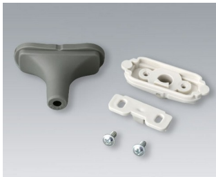
B2911318 Cable gland kit, 4.2 - 5.0 TPE volcano