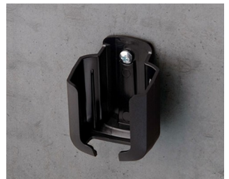
B2921509 Holder S ASA+PC (UL 94 V-0) black RAL 9005