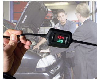
Voltage and current display during trickle charging