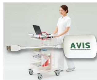
Receiver and data transfer for EMR