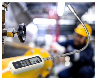
Gas leak detector

Periferiche di computer, tecnica di rete, gestione degli impianti tecnici di edifici, sistemi di sicurezza, IoT/ IIoT, tecnica medica e applicazioni per terapia, strumenti di analisi per laboratori, metrologia, ad esempio rilevatori con sonda di misura, sistemi/strumenti di prova, data logger per tecnica ambientale, sensori, ecc.