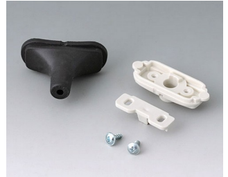
B2911309 Cable gland kit, 3.4 - 4.2 TPE black RAL 9005