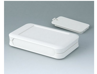
A9052117 SOFT-CASE L ABS (UL 94 HB) off-white RAL 9002 73x117x24mm IP 40