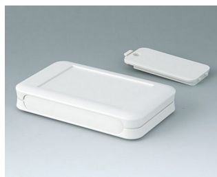
A9051117 SOFT-CASE M ABS (UL 94 HB) off-white RAL 9002 65x105x19mm IP 40