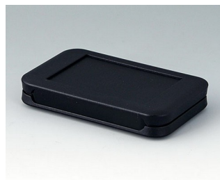
A9050209 SOFT-CASE S PMMA (IR) (UL 94 HB) black RAL 9005 51x82x14mm IP 54 opt., IP 40