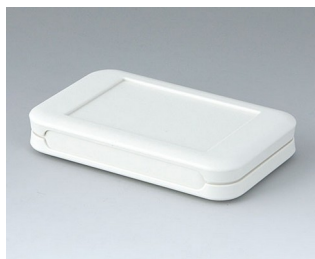
A9050107 SOFT-CASE S ABS (UL 94 HB) off-white RAL 9002 51x82x14mm IP 54 opt., IP 40