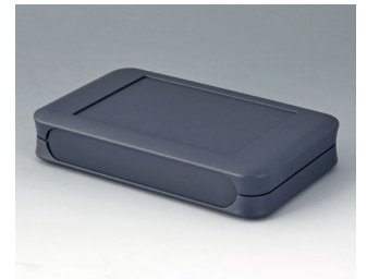
A9053108 SOFT-CASE XL ABS (UL 94 HB) lava 92x150x28mm IP 40