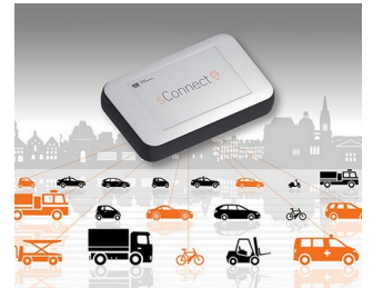
Module for smart mobility applications