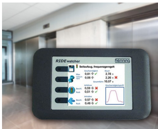
RIDEwatcher Multimeter for ride profiles