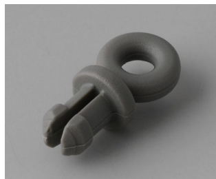
A9100002 Ring eyelet PA 6 volcano