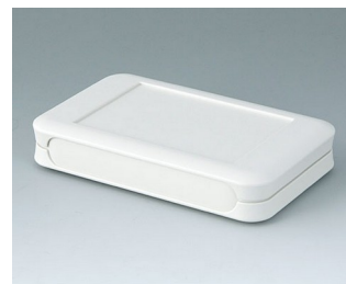
A9051107 SOFT-CASE M ABS (UL 94 HB) off-white RAL 9002 65x105x19mm IP 54 opt., IP 40