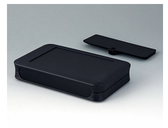
A9053219 SOFT-CASE XL PMMA (IR) (UL 94 HB) black RAL 9005 92x150x28mm IP 40