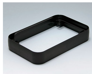
A9152219 Intermediate ring L PMMA (IR) (UL 94 HB) black RAL 9005 76x120x21mm