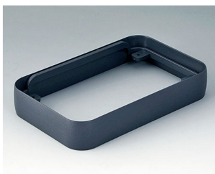
A9152018 Intermediate ring L ABS (UL 94 HB) lava 76x120x21mm