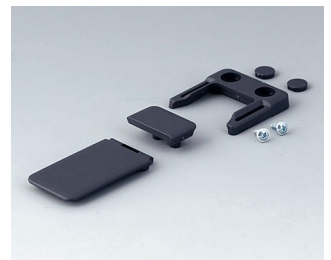
A9152048 Combi-Clip ABS (UL 94 HB) lava 45x27mm