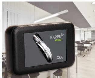
Sensor for measuring carbon dioxide concentration