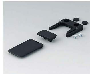
A9152049 Combi-Clip ABS (UL 94 HB) black RAL 9005 45x27mm