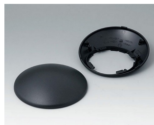
B5010309 Bottom and top part R110 H ABS (UL 94 HB) black RAL 9005 ø110x41mm