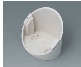
B5011317 Base 55° ABS (UL 94 HB) off-white RAL 9002