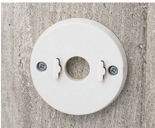
B5111307 Wall mounting set ABS (UL 94 HB) off-white RAL 9002