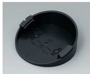
B5011219 Base 30° ABS (UL 94 HB) black RAL 9005