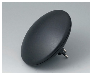
B5011129 ART-CASE R110 H PC+ABS (UL 94 V-0) black RAL 9005 ø110x38mm IP 40