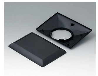
B5017209 Bottom and top part E160 F ABS (UL 94 HB) black RAL 9005 160x110x38mm