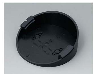
B5011219 Base 30° ABS (UL 94 HB) black RAL 9005