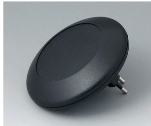
B5011229 ART-CASE R110 F PC+ABS (UL 94 V-0) black RAL 9005 ø110x38mm IP 40