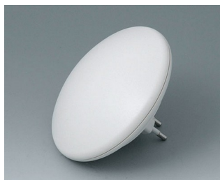
B5011127 ART-CASE R110 H PC+ABS (UL 94 V-0) off-white RAL 9002 ø110x38mm IP 40