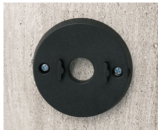
B5111309 Wall mounting set ABS (UL 94 HB) black RAL 9005