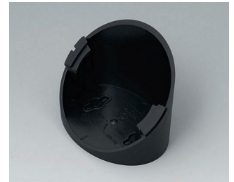
B5011319 Base 55° ABS (UL 94 HB) black RAL 9005