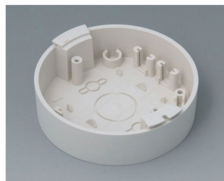
B5011117 Base ABS (UL 94 HB) off-white RAL 9002