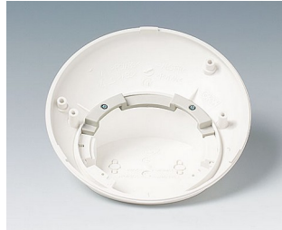
B5111707 Anti-rotation device ABS (UL 94 HB) off-white RAL 9002