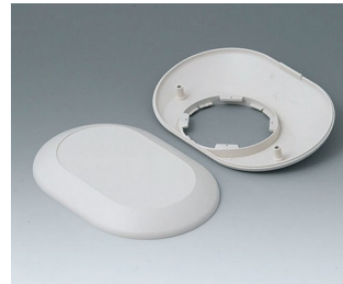
B5015207 Bottom and top part O160 F ABS (UL 94 HB) off-white RAL 9002 160x110x38mm