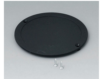
B5011849 Lid ABS (UL 94 HB) black RAL 9005