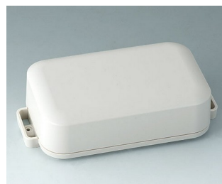
C3208207 EASYTEC 150 ASA+PC (UL 94 V-0) off-white RAL 9002 172x93x46mm IP 65 opt., IP 40