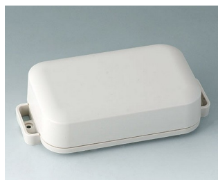
C3207207 EASYTEC 125 ASA+PC (UL 94 V-0) off-white RAL 9002 147x78x37mm IP 65 opt., IP 40