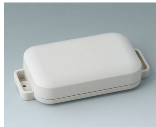
C3206107 EASYTEC 100 ASA+PC (UL 94 V-0) off-white RAL 9002 121x62x26mm IP 65 opt., IP 40