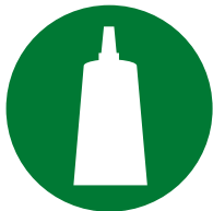
Confezionamento / montaggio