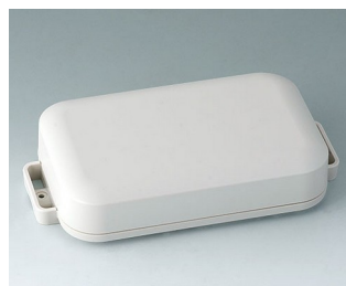
C3208107 EASYTEC 150 ASA+PC (UL 94 V-0) off-white RAL 9002 172x93x36mm IP 65 opt., IP 40