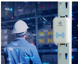
Smart store logistics