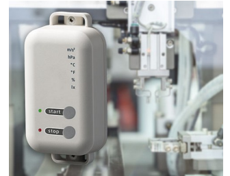
Data logger with gateway function