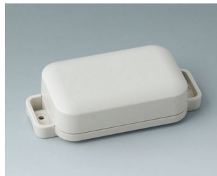
C3204207 EASYTEC 80 ASA+PC (UL 94 V-0) off-white RAL 9002 101x50x26mm IP 65 opt., IP 40