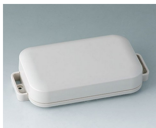
C3207107 EASYTEC 125 ASA+PC (UL 94 V-0) off-white RAL 9002 147x78x30mm IP 65 opt., IP 40