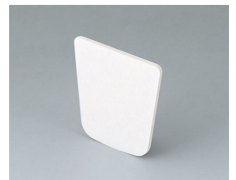
B2903031 Adhesive foil M