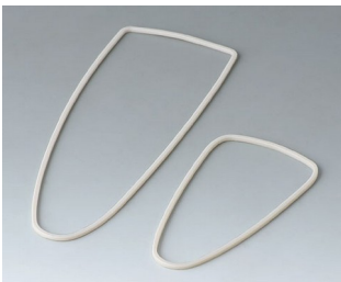
B2904111 Sealing kit L TPV 50A