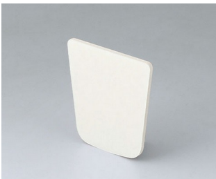
B2902031 Adhesive foil S