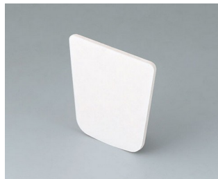
B2903031 Adhesive foil M