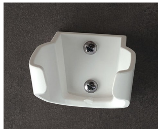
B2903037 Holder M ASA (UL 94 HB) traffic white RAL 9016