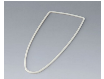
B2904011 Sealing L TPV 50A