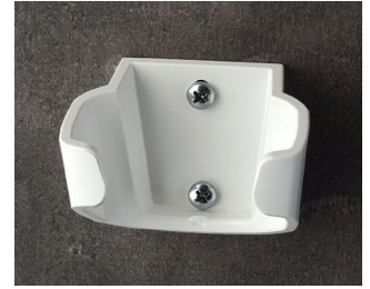
B2904037 Holder L ASA (UL 94 HB) traffic white RAL 9016