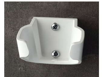
B2904037 Holder L ASA (UL 94 HB) traffic white RAL 9016