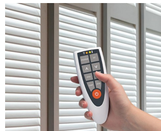
Remote control for room climate