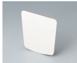
B2904031 Adhesive foil L