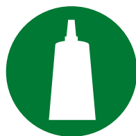
Confezionamento / montaggio