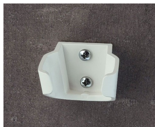
B2902037 Holder S ASA (UL 94 HB) traffic white RAL 9016