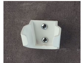
B2902037 Holder S ASA (UL 94 HB) traffic white RAL 9016