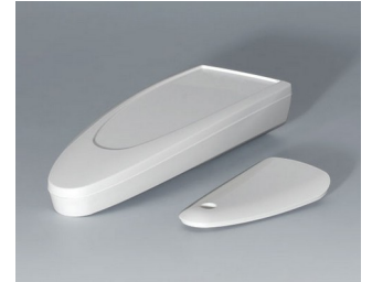
B2803017 STYLE-CASE M ASA (UL 94 HB) traffic white RAL 9016 147x56x27mm IP 65 opt., IP 40