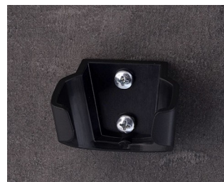
B2902039 Holder S ASA (UL 94 HB) black RAL 9005