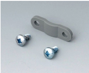
A9199005 Strain relief PA 6 volcano