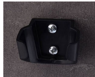
B2903039 Holder M ASA (UL 94 HB) black RAL 9005