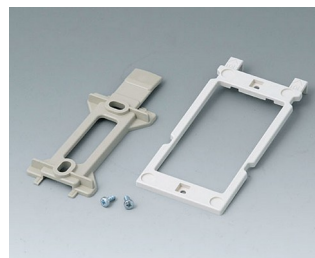
B1350048 Wall suspension elements ABS (UL 94 HB) pebble grey RAL 7032