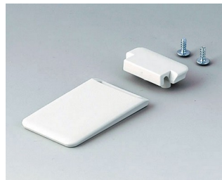
A9152057 Tilt foot bar ABS (UL 94 HB) off-white RAL 9002