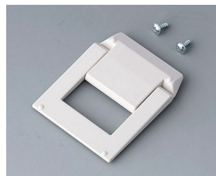
A9250817 Tilt foot bar ABS (UL 94 HB) off-white RAL 9002