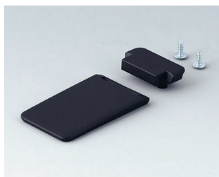
A9152059 Tilt foot bar ABS (UL 94 HB) black RAL 9005