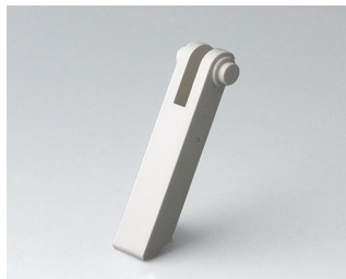
A0350007 Tilt foot ABS (UL 94 HB) off-white RAL 9002