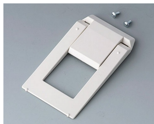
A9250807 Tilt foot bar ABS (UL 94 HB) off-white RAL 9002