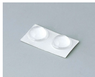
A9210290 Anti-slide feet 9.5 x 3.8 mm transparent