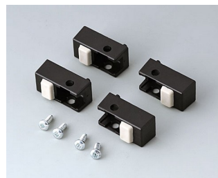
A9257109 Case feet, Vers. I ABS (UL 94 HB) black RAL 9005