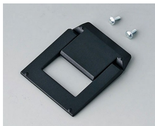
A9250819 Tilt foot bar ABS (UL 94 HB) black RAL 9005