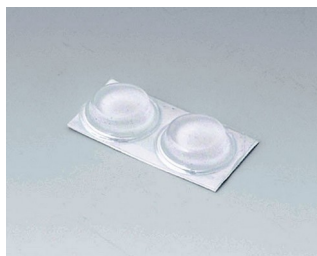
A9212330 Anti-slide feet 12 x 3.5 mm transparent