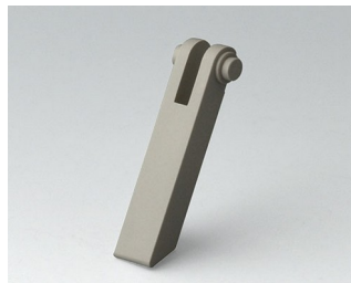
A0350008 Tilt foot ABS (UL 94 HB) pebble grey RAL 7032