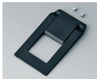
A9250809 Tilt foot bar ABS (UL 94 HB) black RAL 9005