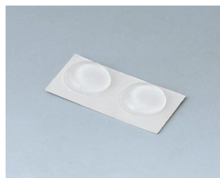
A9210180 Anti-slide feet 10,1 x 1.8 mm transparent