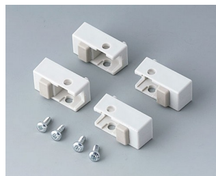
A9257107 Case feet, Vers. I ABS (UL 94 HB) off-white RAL 9002