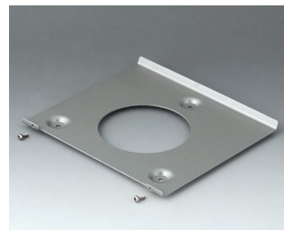
B4522101 Wall suspension element 220 Aluminium