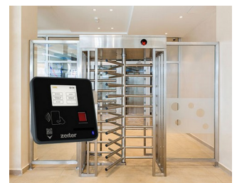
Terminal for access control