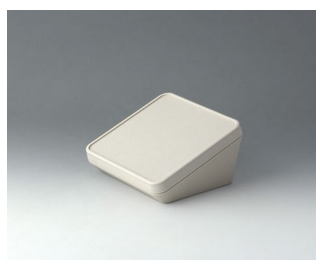
B4414107 PROTEC 140, Vers. I ASA+PC (UL 94 V-0) off-white RAL 9002 140x140x76mm IP 65 opt.