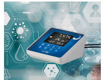
Laboratory measuring device