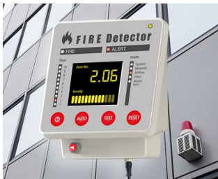
Terminal for fire alarm systems