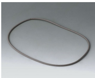
B4514030 Sealing 140