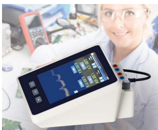
Multimeter measuring device