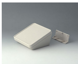
B4414207 PROTEC 140, Vers. II ASA+PC (UL 94 V-0) off-white RAL 9002 140x140x76mm IP 65 opt.