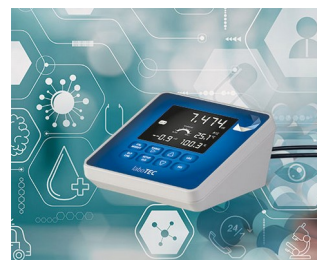
Laboratory measuring device