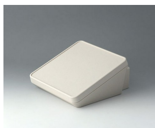
B4418307 PROTEC 180, Vers. III ASA+PC (UL 94 V-0) off-white RAL 9002 180x201x92mm IP 65 opt.