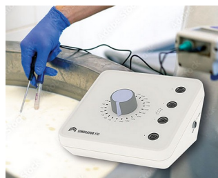
Simulator for testing measuring instruments