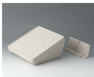
B4418207 PROTEC 180, Vers. II ASA+PC (UL 94 V-0) off-white RAL 9002 180x180x92mm IP 65 opt.