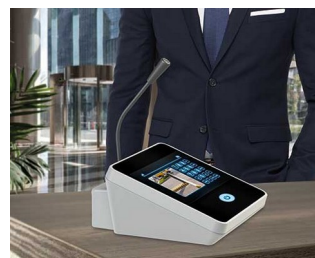
Table microphone / inter phone