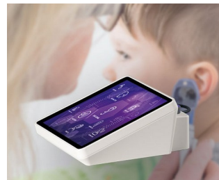
Hearing test device