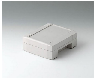
C8011132 SOLID-BOX 115 PC+ABS (UL 94 V-0) light grey RAL 7035 135x115x50mm IP 66, IP 67, IK 08