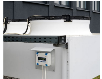
Heating/air conditioning/ventilation control