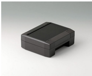
C8011131 SOLID-BOX 115 PC+ABS (UL 94 V-0) anthracite grey RAL 7016 135x115x50mm IP 66, IP 67, IK 08