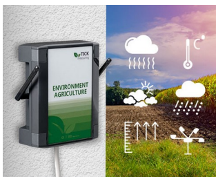
Weather station in agriculture