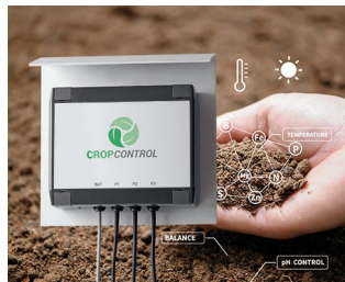
Smart Farming - system for long-term measurements