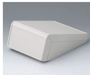
B4056127 UNITEC M, 1.4/0.6 ABS (UL 94 HB) off-white RAL 9002 148x210x80mm IP 40