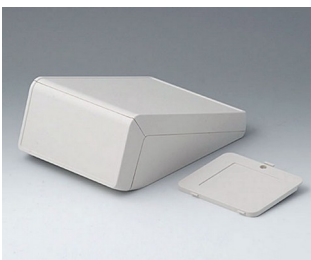
B4056307 UNITEC M, 0.6/0.6 ABS (UL 94 HB) off-white RAL 9002 148x210x80mm IP 40