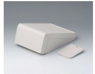
B4054237 UNITEC S, 0.6/1.4 ABS (UL 94 HB) off-white RAL 9002 125x177x69mm IP 40