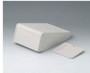
B4054327 UNITEC S, 1.4/0.6 ABS (UL 94 HB) off-white RAL 9002 125x177x69mm IP 40