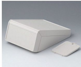
B4056217 UNITEC M, 1.4/1.4 ABS (UL 94 HB) off-white RAL 9002 148x210x80mm IP 40