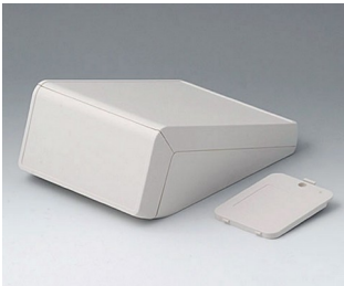
B4056207 UNITEC M, 0.6/0.6 ABS (UL 94 HB) off-white RAL 9002 148x210x80mm IP 40