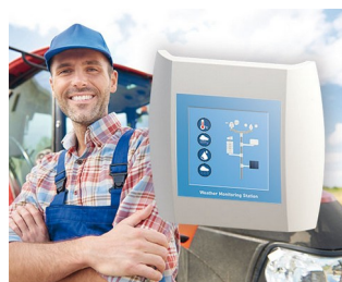
Station de surveillance météorologique