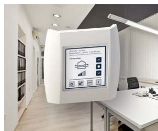
Contrôle de la qualité de l'air intérieur