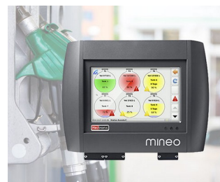
Contrôleur pour la gestion intelligente du réservoir