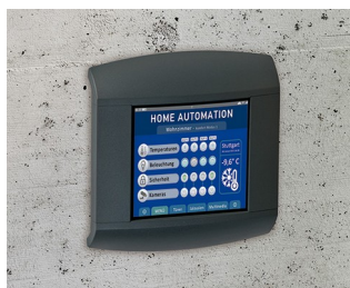
Panel d'intérieur/de contrôle en domotique