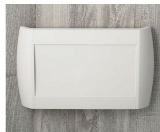
A9095107 DIATEC L ABS (UL 94 HB) gris blanc RAL 9002 330x48x200mm IP 40