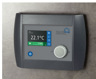
Solar Control Panel