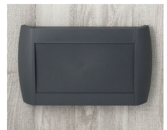
A9095108 DIATEC L ABS (UL 94 HB) lava 330x48x200mm IP 40