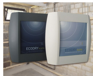
Systèmes de déshumidification des murs