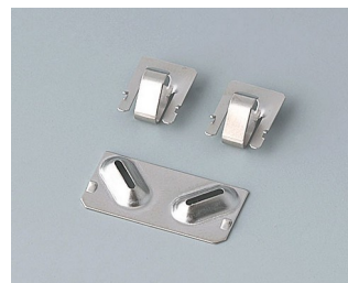
A9190003 Resorts de contact, 2xN/2xAA/2xAAA Acier nickelé