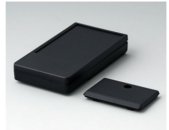
A9071219 DATEC-POCKET-BOX M PMMA (IR) (UL 94 HB) noir RAL 9005 105x58x18,5mm IP 54