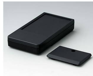
A9072219 DATEC-POCKET-BOX L PMMA (IR) (UL 94 HB) noir RAL 9005 120x65x22mm IP 54