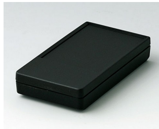
A9070219 DATEC-POCKET-BOX S PMMA (IR) (UL 94 HB) noir RAL 9005 85x46x16mm IP 54