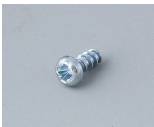
A0304031 Vis Autotaraudeuses 2,2 x 5 mm (PZ1)