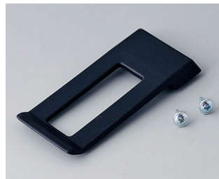
A9172109 Clip de poche ABS (UL 94 HB) noir RAL 9005 62x30mm