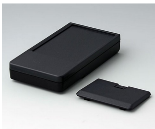
A9072229 DATEC-POCKET-BOX L PMMA (IR) (UL 94 HB) noir RAL 9005 120x65x22mm IP 41