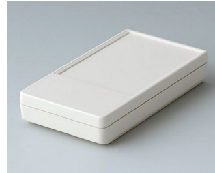
A9070117 DATEC-POCKET-BOX S ABS (UL 94 HB) gris blanc RAL 9002 85x46x16mm IP 54