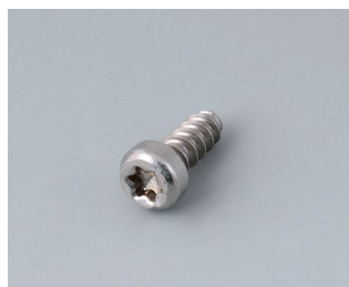
A0325060 Vis autotaraudeuse 2,5 x 6 mm (T8) Acier inoxydable

Sous réserve de modifications techniques. © OKW Gehäusesysteme, Buchen/Allemagne.