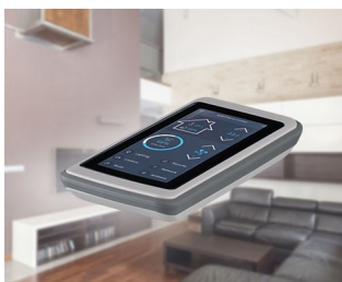
Contrôle de la maison intelligente

Idéal pour les applications électroniques mobiles à l'intérieur et à l'extérieur. Technique de mesure et de régulation, communication sans fil, IoT/IIoT, technique médicale et de laboratoire, santé, office, technique de sécurité, technologie environnementale, etc.