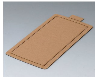
B5503300 Feuille adhésive M