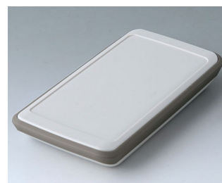
B5403217 SLIM-CASE M, Vers. V ASA+PC (UL 94 V-0) gris blanc RAL 9002 148x74x22mm IP 54