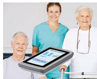
Système de vérification des capteurs