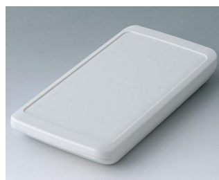
B5403207 SLIM-CASE M, Vers. II ASA+PC (UL 94 V-0) gris blanc RAL 9002 148x74x19mm IP 65 opt., IP 40