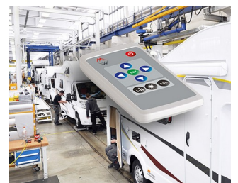
Télécommande pour la décoration intérieure