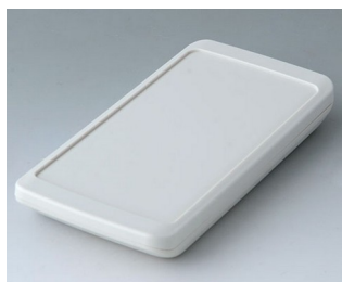
B5403307 SLIM-CASE M, Vers. III ASA+PC (UL 94 V-0) gris blanc RAL 9002 148x74x19mm IP 65 opt., IP 40