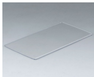
B5503201 Vitre frontale M PC transparent 125,3x63,5x1,3mm