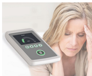
Le biofeedback pour réduire le stress