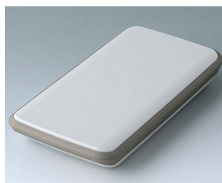
B5403117 SLIM-CASE M, Vers. IV ASA+PC (UL 94 V-0) gris blanc RAL 9002 148x74x22mm IP 54