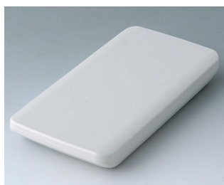
B5403107 SLIM-CASE M, Vers. I ASA+PC (UL 94 V-0) gris blanc RAL 9002 148x74x19mm IP 65 opt., IP 40