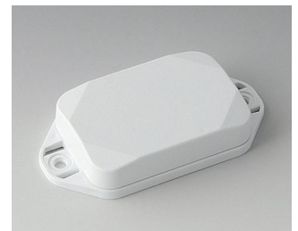
B1822127 MINI-DATA-BOX EF40, plate avec bride ASA+PC (UL 94 V-0) blanc signalisation RAL 9016 60x40x15mm IP 65 opt., IP 40