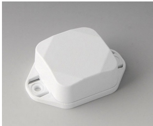
B1802227 MINI-DATA-BOX SF40, haute avec bride ASA+PC (UL 94 V-0) blanc signalisation RAL 9016 40x40x20mm IP 65 opt., IP 40