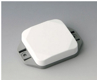
B1804126 MINI-DATA-BOX SF50, plate avec bride ASA+PC (UL 94 V-0) blanc signalisation RAL 9016 50x50x15mm IP 65 opt., IP 40