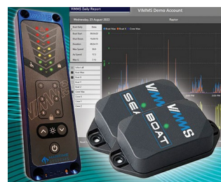
Système de surveillance des chocs et des mouvements des navires