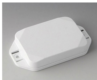
B1824127 MINI-DATA-BOX EF50, plate avec bride ASA+PC (UL 94 V-0) blanc signalisation RAL 9016 70x50x15mm IP 65 opt., IP 40