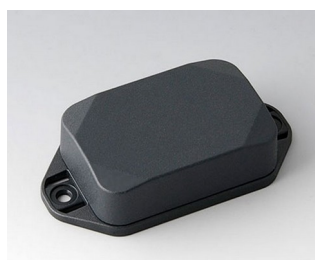
B1822228 MINI-DATA-BOX EF40, haute avec bride ASA+PC (UL 94 V-0) gris anthracite RAL 7016 60x40x20mm IP 65 opt., IP 40