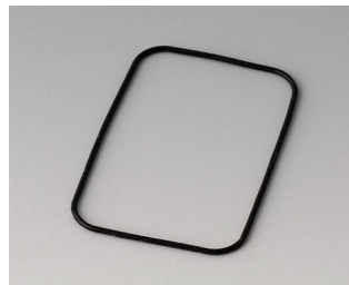
B1922101 Joint E40/EF40