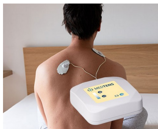
Appareil TENS pour le traitement de la douleur

Idéal pour les applications électroniques miniaturisées et la technologie moderne des capteurs, à l'intérieur comme à l'extérieur. IoT/IIoT, technologie des capteurs, logistique intelligente, périphériques et appareils d'interface, automatisation, technique de l'environnement, technique de mesure et de commande, techniques de sécurité et de surveillance, technologies de l'information et de la communication (TIC), etc.