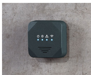
Point d'accès sans fil