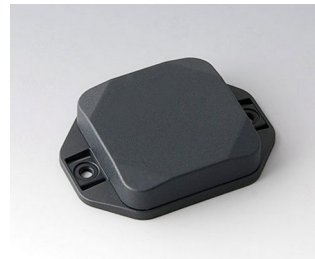
B1804128 MINI-DATA-BOX SF50, plate avec bride ASA+PC (UL 94 V-0) gris anthracite RAL 7016 50x50x15mm IP 65 opt., IP 40