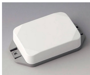
B1824226 MINI-DATA-BOX EF50, haute avec bride ASA+PC (UL 94 V-0) blanc signalisation RAL 9016 70x50x20mm IP 65 opt., IP 40