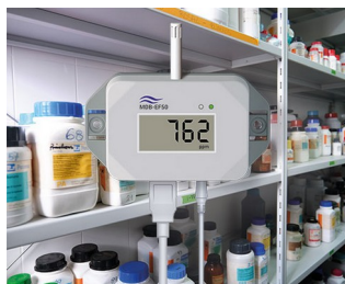
Détecteur de gaz pour substances dangereuses