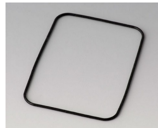
B1924101 Joint E50/EF50

Sous réserve de modifications techniques. © OKW Gehäusesysteme, Buchen/Allemagne.