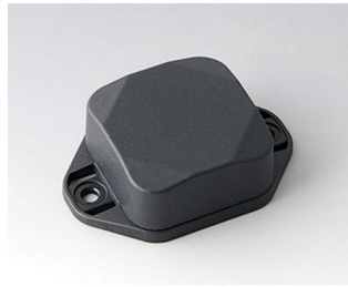
B1802228 MINI-DATA-BOX SF40, haute avec bride ASA+PC (UL 94 V-0) gris anthracite RAL 7016 40x40x20mm IP 65 opt., IP 40