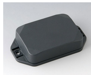
B1824228 MINI-DATA-BOX EF50, haute avec bride ASA+PC (UL 94 V-0) gris anthracite RAL 7016 70x50x20mm IP 65 opt., IP 40