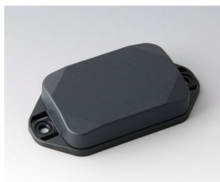
B1822128 MINI-DATA-BOX EF40, plate avec bride ASA+PC (UL 94 V-0) gris anthracite RAL 7016 60x40x15mm IP 65 opt., IP 40