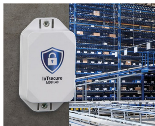
Autorisation d'accès des transpondeurs