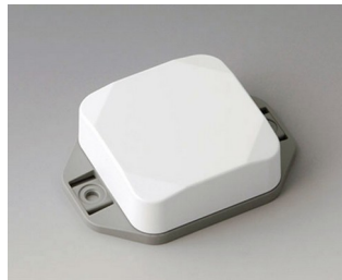
B1804226 MINI-DATA-BOX SF50, haute avec bride ASA+PC (UL 94 V-0) blanc signalisation RAL 9016 50x50x20mm IP 65 opt., IP 40