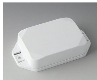
B1824227 MINI-DATA-BOX EF50, haute avec bride ASA+PC (UL 94 V-0) blanc signalisation RAL 9016 70x50x20mm IP 65 opt., IP 40