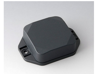
B1804228 MINI-DATA-BOX SF50, haute avec bride ASA+PC (UL 94 V-0) gris anthracite RAL 7016 50x50x20mm IP 65 opt., IP 40