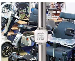
Enregistreur de données pour les opérations de conduite