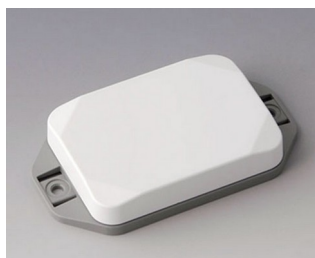
B1824126 MINI-DATA-BOX EF50, plate avec bride ASA+PC (UL 94 V-0) blanc signalisation RAL 9016 70x50x15mm IP 65 opt., IP 40