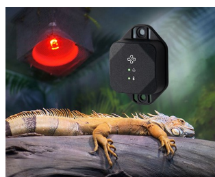
Surveillance des conditions environnementales