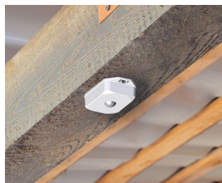
Détecteur de mouvement avec capteur pour contrôle automatique