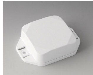
B1804227 MINI-DATA-BOX SF50, haute avec bride ASA+PC (UL 94 V-0) blanc signalisation RAL 9016 50x50x20mm IP 65 opt., IP 40