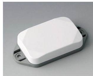
B1822126 MINI-DATA-BOX EF40, plate avec bride ASA+PC (UL 94 V-0) blanc signalisation RAL 9016 60x40x15mm IP 65 opt., IP 40