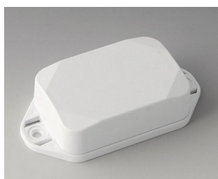
B1822227 MINI-DATA-BOX EF40, haute avec bride ASA+PC (UL 94 V-0) blanc signalisation RAL 9016 60x40x20mm IP 65 opt., IP 40