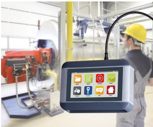
Appareil de diagnostic mobile pour machines

Appareils périphériques et interfaces, bureau, communication, technique de sécurité, biométrie, technique médicale et de laboratoire, santé, automatisation, industrie 4.0, usine intelligente, technique de mesure, de régulation et de commande, etc.