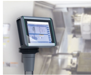
Panneau multi-touch pour le contrôle de la machine