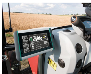
Terminal ISOBUS pour tracteurs et machines agricoles