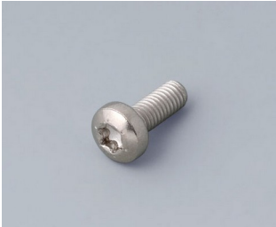
A0330080 Vis M3 x 8 mm (T10) Acier inoxydable