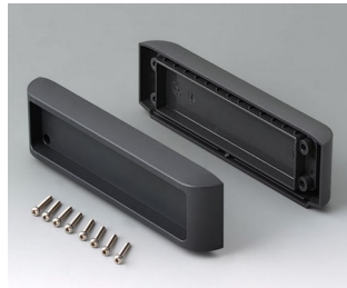
B3507011 Jeu de couvercles ASA+PC (UL 94 V-0) lava