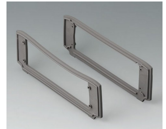
B3507017 Jeu de joints, volcan TPV 50A volcan