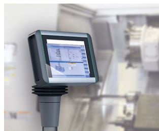
Panneau multi-touch pour le contrôle de la machine