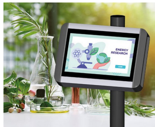
Terminal de recherche végétale