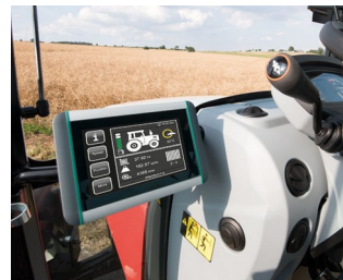
Terminal ISOBUS pour tracteurs et machines agricoles