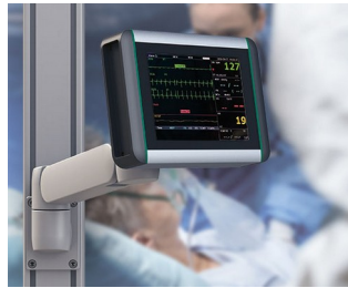
Moniteur de surveillance des signes vitaux