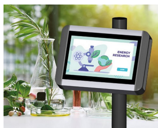
Terminal de recherche végétale