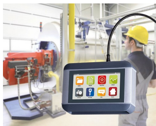
Appareil de diagnostic mobile pour machines

Appareils périphériques et interfaces, bureau, communication, technique de sécurité, biométrie, technique médicale et de laboratoire, santé, automatisation, industrie 4.0, usine intelligente, technique de mesure, de régulation et de commande, etc.