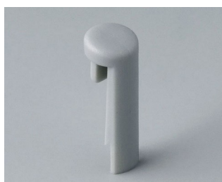
A1101007 Goupille PA 6 (UL 94 HB) minéral