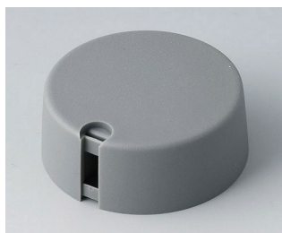
A1040648 TOP-KNOBS 40 PA 6 volcan 40x16mm