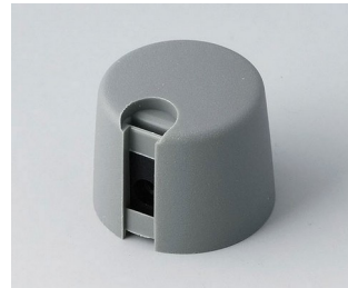
A1020048 TOP-KNOBS 20 PA 6 volcan 20x16mm 4mm