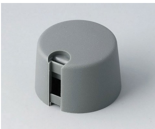
A1024068 TOP-KNOBS 24 PA 6 volcan 24x16mm 6mm