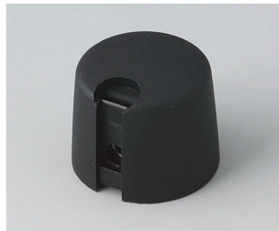
A1020649 TOP-KNOBS 20 PA 6 néro 20x16mm