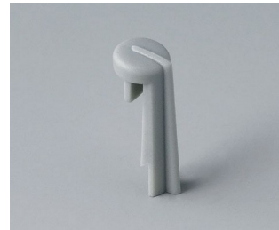
A1105007 Skala PA 6 (UL 94 HB) minéral