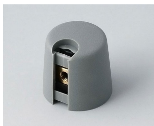
A1016048 TOP-KNOBS 16 PA 6 volcan 16x16mm 4mm