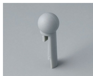
A1102007 À bout sphérique PA 6 (UL 94 HB) minéral