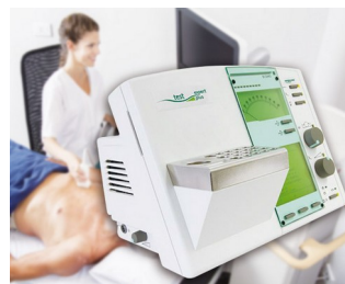
Élément de commande pour appareil de diagnostic