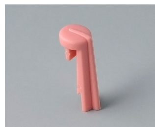
A1105003 Skala PA 6 (UL 94 HB) corail