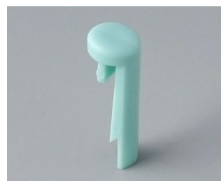
A1101005 Goupille PA 6 (UL 94 HB) lagon