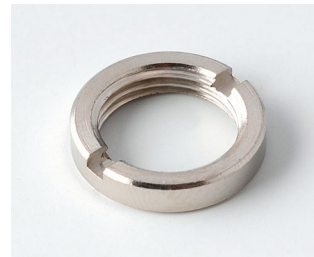
A6295009 Écrou rond 3/8"-32G

Sous réserve de modifications techniques. © OKW Gehäusesysteme, Buchen/Allemagne.