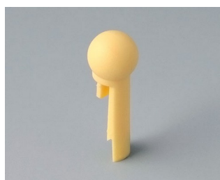
A1102004 À bout sphérique PA 6 (UL 94 HB) plage