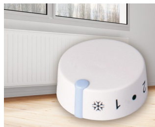
Thermostat encastrable pour chauffage électrique à accumulation