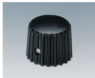
A1321160 BOUTON, à fixation latérale par vis ABS (UL 94 HB) noir RAL 9005 20x16mm 6mm