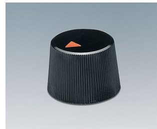
A1316240 BOUTON, à fixation latérale par vis ABS (UL 94 HB) noir RAL 9005 16,4x12,3mm 4mm