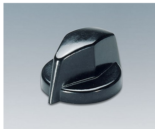
A1311860 BOUTON, à fixation latérale par vis PF noir RAL 9005 18,8x12,5mm 6mm