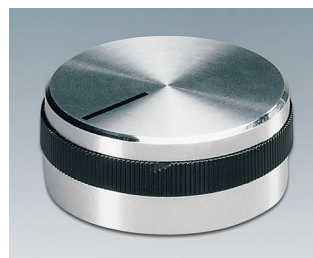
A1432469 BOUTON, à fixation latérale par vis ABS (UL 94 HB) brillant 31,9x14mm 6mm