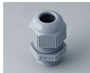
C2316418 Passe-câble à vis M16x1,5 PA 6 gris argent RAL 7001