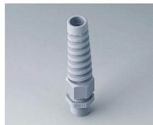
C2320528 Passe-câble à vis M20x1,5 PA 6 gris argent RAL 7001