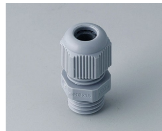
C2312418 Passe-câble à vis M12x1,5 PA 6 gris argent RAL 7001