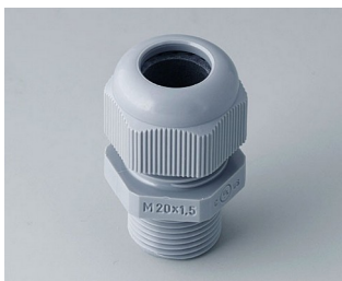
C2320428 Passe-câble à vis M20x1,5 PA 6 gris argent RAL 7001