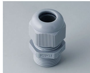
C2320418 Passe-câble à vis M20x1,5 PA 6 gris argent RAL 7001