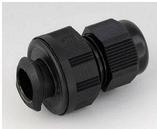
C2316719 Passe-câble à vis, M16, quick fix PA 6 noir RAL 9005