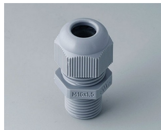
C2316618 Passe câble à vis M16x1,5 PA gris argent RAL 7001