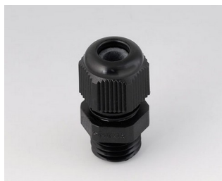
C2312419 Passe-câble à vis M12x1,5 PA 6 noir RAL 9005