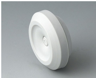
C2320147 Passe-câble TPE gris clair RAL 7035