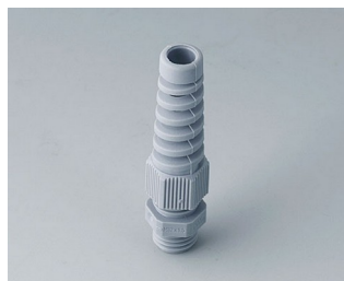
C2312518 Passe-câble à vis M12x1,5 PA 6 gris argent RAL 7001