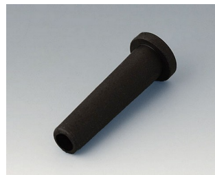
C2353849 Passe-câble souple Ø 5.3 noir