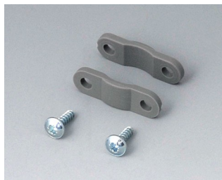
A9166004 Jeu de décharge de traction PA 6 volcan