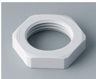
C2320117 Contre-écrou M20x1,5 PA 6 gris clair RAL 7035