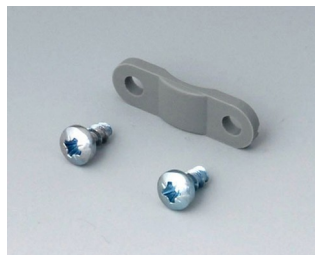
A9199005 Décharge de traction PA 6 volcan