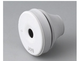
C2320137 Passe-câble EPDM gris clair RAL 7035