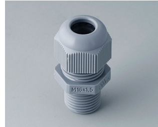
C2316618 Passe câble à vis M16x1,5 PA 6 gris argent RAL 7001