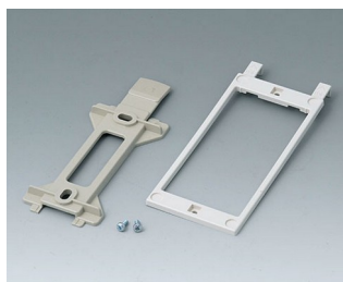
B1360048 Jeu de support mural ABS (UL 94 HB) gris silex RAL 7032