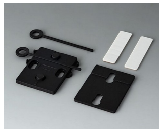
A9305019 Jeu de support mural ASA+PC (UL 94 V-0) noir RAL 9005