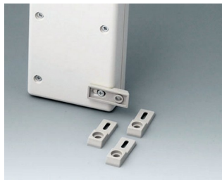
A9204108 Pattes de fixation PA 6 gris silex RAL 7032