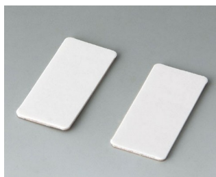
A9305147 Support pour pellicule adhésive

Sous réserve de modifications techniques. © OKW Gehäusesysteme, Buchen/Allemagne.