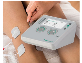
Compteur de biofeedback