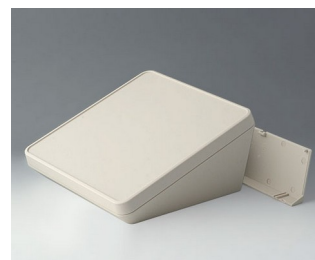
B4422207 PROTEC 220, Vers. II ASA+PC (UL 94 V-0) gris blanc RAL 9002 220x220x108mm IP 65 opt.