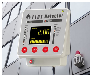
Terminal pour systèmes d'alarme incendie