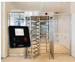
Terminal pour le contrôle d'accès