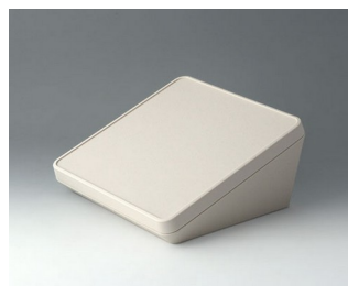
B4422107 PROTEC 220, Vers. I ASA+PC (UL 94 V-0) gris blanc RAL 9002 220x220x108mm IP 65 opt.