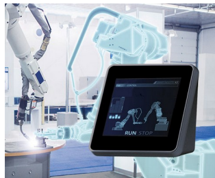
Contrôle des robots