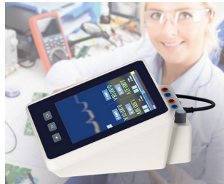
Appareil de mesure multimètre