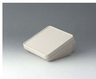
B4414307 PROTEC 140, Vers. III ASA+PC (UL 94 V-0) gris blanc RAL 9002 140x160x76mm IP 65 opt.