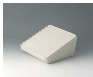
B4418107 PROTEC 180, Vers. I ASA+PC (UL 94 V-0) gris blanc RAL 9002 180x180x92mm IP 65 opt.