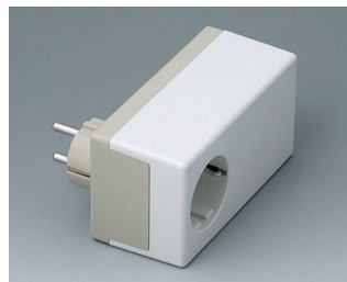
A9022465 BOITIER PRISE D, Vers. II PC+ABS (UL 94 V-0) gris silex RAL 7032 120x65x55mm