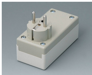
A9011665 BOITIER PRISE F / D, Vers. I PC+ABS (UL 94 V-0) gris blanc RAL 9002 100x50x40mm