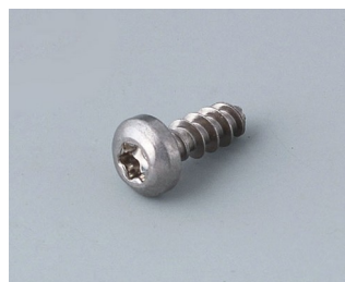
A0308132 Vis autotaraudeuse 3 x 8 mm (T10) Acier inoxydable

Sous réserve de modifications techniques.