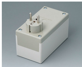
A9021665 BOITIER PRISE F / D, Vers. I PC+ABS (UL 94 V-0) gris silex RAL 7032 120x65x65mm