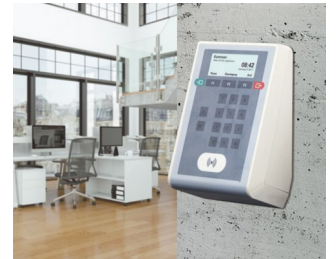
Terminal de badgeage