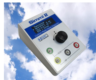
Simulateur de signal biologique