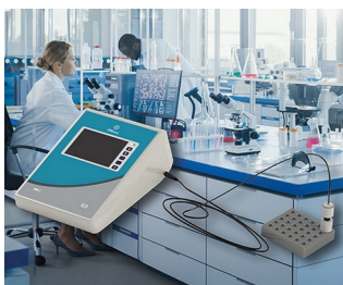
Appareil de mesure pour laboratoire et recherche

Systèmes de saisie de données, terminaux d'accès et d'information, domotique, périphériques d'ordinateur, communication, applications d'analyse, de diagnostic et de thérapie, technique de mesure et de régulation et commandes industrielles.