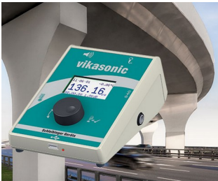
Appareil de mesure à ultrasons

Systèmes de saisie de données, terminaux d'accès et d'information, domotique, périphériques d'ordinateur, communication, applications d'analyse, de diagnostic et de thérapie, technique de mesure et de régulation et commandes industrielles.