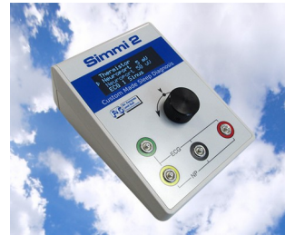
Simulateur de signal biologique