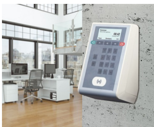
Terminal de badgeage