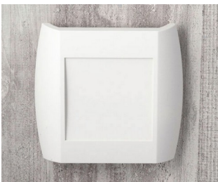
A9092107 DIATEC XS ABS (UL 94 HB) grauweiß RAL 9002 150x37x155mm IP 40