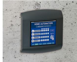
Kontrollpanel für Home Automation