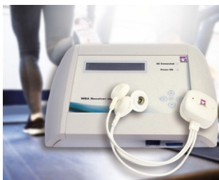
WBA-Empfangeinheit zur Messung von Biosignalen