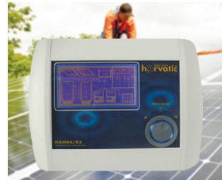
Steuerung der Photovoltaik-Solaranlage