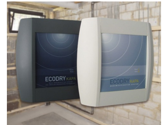
Systeme zur Mauerwerkentfeuchtung