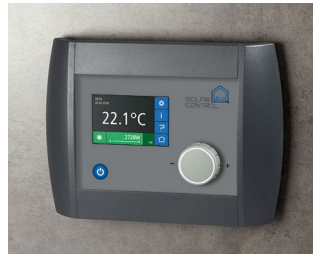
Solar Control Panel