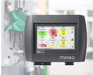
Controller für intelligentes Tankmanagement

Computerperipherie und Datentechnik, IoT/IIoT, Gateways, Datenerfassungssysteme am Arbeitsplatz, Sprech- und Überwachungsanlagen, Zugangskontrollgeräte, Mess- und Regeltechnik, Labor- und Medizintechnik, etc.