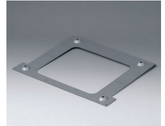
B4130147 Wandhalter L Stahl verzinkt 214x260x12mm

Technische Änderungen vorbehalten. © OKW Gehäusesysteme, Buchen/Deutschland.