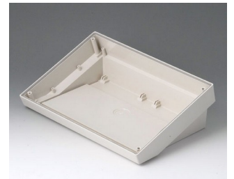
B4026117 DATEC-TERMINAL SL ABS (UL 94 HB) grauweiß RAL 9002 264x180x86mm IP 54 opt.