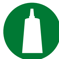
Konfektion / Montage