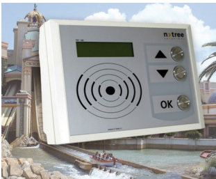
Vielfältiges Terminal für Freizeitanlagen