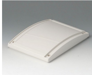
B4013637 Haube S, konvex ABS (UL 94 HB) grauweiß RAL 9002 130x180x28mm