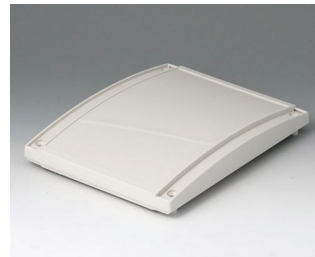
B4016637 Haube M, konvex ABS (UL 94 HB) grauweiß RAL 9002 168x220x29mm