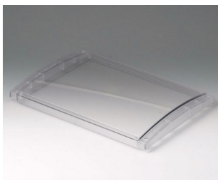
B4030631 Haube L, konvex PC (UL 94 V-0) transparent 302x220x29mm