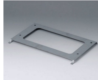
B4126147 Wandhalter SL Stahl verzinkt 210x137x8mm