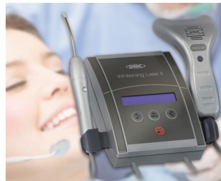
Zahnaufhellungssystem und Lasertherapie