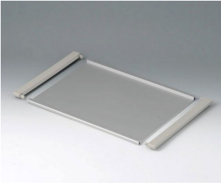
B4130126 Profilplatte L Aluminium matt eloxiert 302x220x8mm