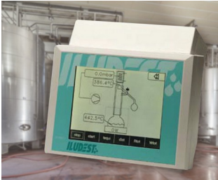
Gerät zur Überwachung und Steuerung von Destillationseinheiten

Datenerfassungssysteme am Arbeitsplatz und an Maschinen, Datentechnik, Zugangskontrollen, Sprech- und Überwachungsanlagen, Medizintechnik, Health Care, Messen, Steuern, Regeln, Heizungs- und Klimatechnik, etc.