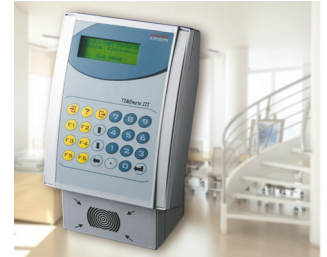
Terminal für Zeiterfassung, Zutrittskontrolle und Auftragssteuerung