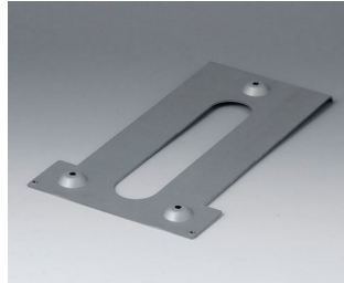
B4116147 Wandhalter M Stahl verzinkt 214x126x12mm