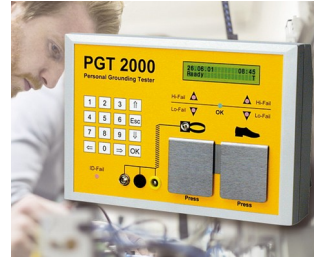
System gegen Elektrostatik