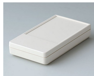
A9070117 DATEC-POCKET-BOX S ABS (UL 94 HB) grauweiß RAL 9002 85x46x16mm IP 54