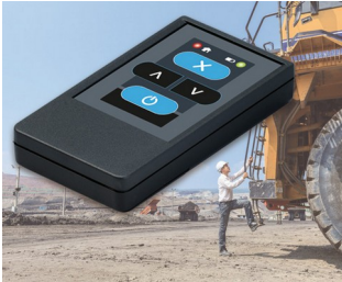
Funksender für Maschinen

Ideal für Impulsgeber und -empfänger, Mess- und Regeltechnik, Impulsgeber für Ultraschall und Infrarot, Sensorik, Optoelektronik, Fernsteuerungen vielfältiger Art, Drahtlose Kommunikation, Mobile Datenerfassung, etc.