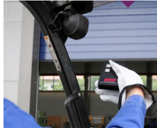
IR-Fernbedienung für raue Umgebung