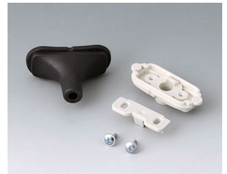
B2911329 Kabeltüllen-Set, 5,0 - 5,9 TPE schwarz RAL 9005