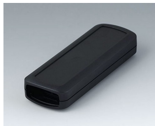
B2824109 CONNECT S ASA+PC (UL 94 V-0) schwarz RAL 9005 120x42x22mm