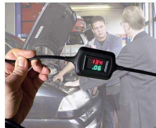
Spannungs- und Stromanzeige bei der Erhaltungsladung