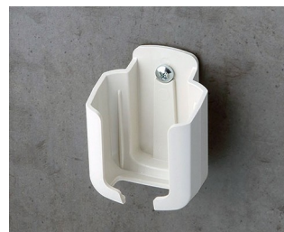
B2921507 Halter S ASA+PC (UL 94 V-0) grauweiß RAL 9002