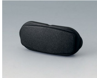
B2811209 Stirnteil ASA+PC (UL 94 V-0) schwarz RAL 9005