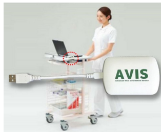
Receiver zur Datenübertragung in elektronische Krankenakte