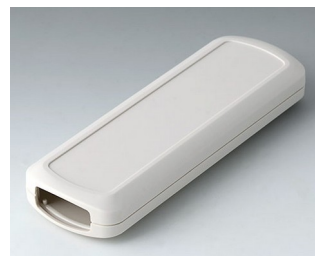
B2834107 CONNECT M ASA+PC (UL 94 V-0) grauweiß RAL 9002 156x54x22mm