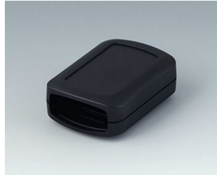
B2822109 CONNECT S ASA+PC (UL 94 V-0) schwarz RAL 9005 60x42x22mm