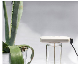
Herstellung kolloidaler Silberlösung