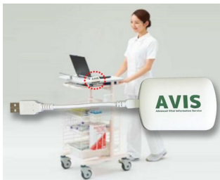
Receiver zur Datenübertragung in elektronische Krankenakte