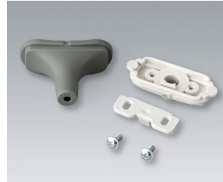
B2911308 Kabeltüllen-Set, 3,4 - 4,2 TPE vulkan