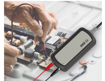
Interface für Prüfspitzen bei PC-Anwendungen