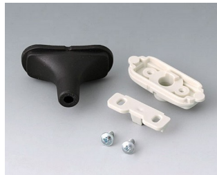
B2911319 Kabeltüllen-Set, 4,2 - 5,0 TPE schwarz RAL 9005