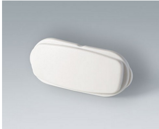
B2811207 Stirnteil ASA+PC (UL 94 V-0) grauweiß RAL 9002