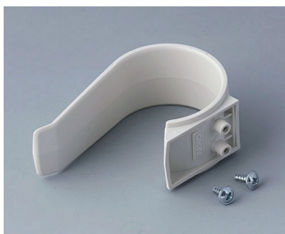
A9167027 Halteklammer PA 6 (UL 94 HB) grauweiß RAL 9002