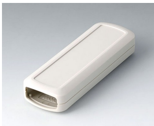
B2824107 CONNECT S ASA+PC (UL 94 V-0) grauweiß RAL 9002 120x42x22mm