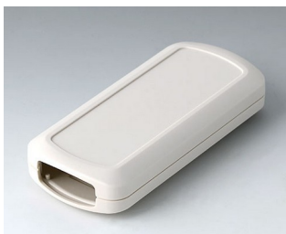
B2833107 CONNECT M ASA+PC (UL 94 V-0) grauweiß RAL 9002 116x54x22mm