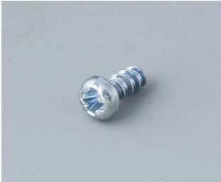
A0304031 Selbstformende Schraube 2,2 x 5 mm (PZ1)

Technische Änderungen vorbehalten. © OKW Gehäusesysteme, Buchen/Deutschland.