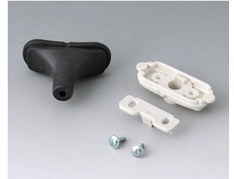
B2911309 Kabeltüllen-Set, 3,4 - 4,2 TPE schwarz RAL 9005