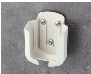
B2931507 Halter M ASA+PC (UL 94 V-0) grauweiß RAL 9002