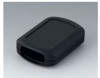
B2832109 CONNECT M ASA+PC (UL 94 V-0) schwarz RAL 9005 76x54x22mm