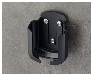
B2931509 Halter M ASA+PC (UL 94 V-0) schwarz RAL 9005