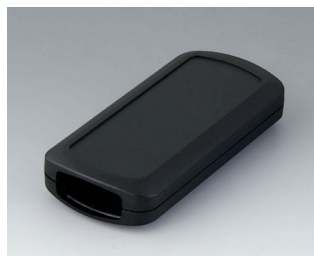
B2833109 CONNECT M ASA+PC (UL 94 V-0) schwarz RAL 9005 116x54x22mm