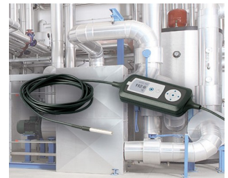
Prozessüberwachung mit Temperatursensor