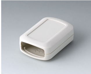
B2822107 CONNECT S ASA+PC (UL 94 V-0) grauweiß RAL 9002 60x42x22mm