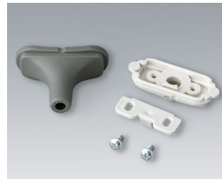
B2911328 Kabeltüllen-Set, 5,0 - 5,9 TPE vulkan