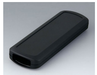
B2834109 CONNECT M ASA+PC (UL 94 V-0) schwarz RAL 9005 156x54x22mm