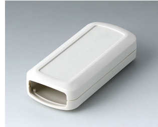
B2823107 CONNECT S ASA+PC (UL 94 V-0) grauweiß RAL 9002 90x42x22mm