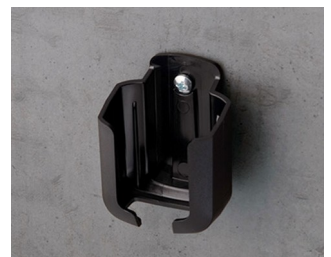
B2921509 Halter S ASA+PC (UL 94 V-0) schwarz RAL 9005