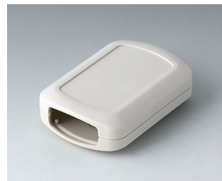
B2832107 CONNECT M ASA+PC (UL 94 V-0) grauweiß RAL 9002 76x54x22mm