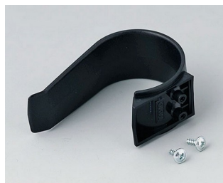
A9167029 Halteklammer PA 6 (UL 94 HB) schwarz RAL 9005