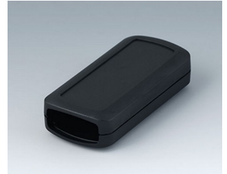
B2823109 CONNECT S ASA+PC (UL 94 V-0) schwarz RAL 9005 90x42x22mm