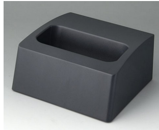
A9107508 Sockel L ASA+PC (UL 94 V-0) lava