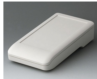
A9006117 DATEC-COMPACT M ASA+PC (UL 94 V-0) grauweiß RAL 9002 172x92x39mm IP 41