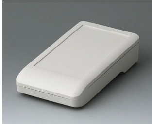
A9005107 DATEC-COMPACT S ASA+PC (UL 94 V-0) grauweiß RAL 9002 136x74x32mm IP 65