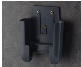
A9107628 Halter L ASA+PC (UL 94 V-0) lava