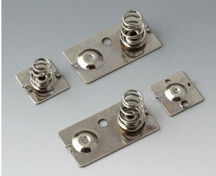
A9190023 Kontaktfedern-Set, 3 x AA Stahl vernickelt