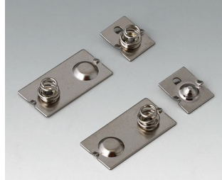
A9190024 Kontaktfedern-Set, 3 x AAA Stahl vernickelt