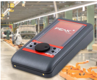
Mobiles Diagnosegerät für CAN- und CAN-FD-Busse