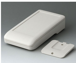
A9006207 DATEC-COMPACT M ASA+PC (UL 94 V-0) grauweiß RAL 9002 172x92x39mm IP 65