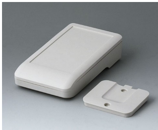
A9005207 DATEC-COMPACT S ASA+PC (UL 94 V-0) grauweiß RAL 9002 136x74x32mm IP 65