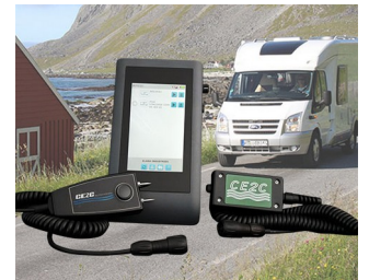
System zur Feuchtigkeitskontrolle an Freizeit-Fahrzeugen