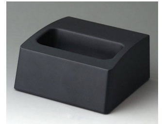
A9106508 Sockel M ASA+PC (UL 94 V-0) lava