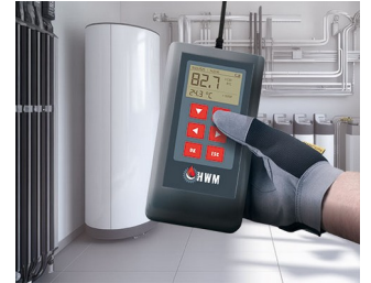
Messgerät für Heizwasser