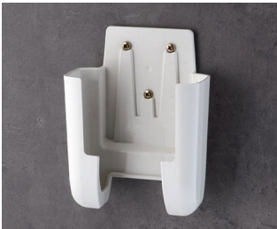
A9107627 Halter L ASA+PC (UL 94 V-0) grauweiß RAL 9002