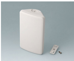
B4608107 SMART-CONTROL S, Ausf. I ASA+PC-FR (UL 94 V-0) grauweiß RAL 9002 142x81x46mm IP 55 opt., IP 40