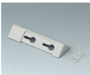
B4705207 Tischhalter-Set ASA+PC-FR (UL 94 V-0)