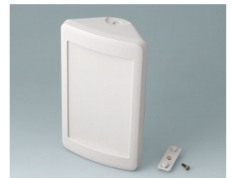
B4610207 SMART-CONTROL M, Ausf. II ASA+PC-FR (UL 94 V-0) grauweiß RAL 9002 173x101x59mm IP 55 opt., IP 40