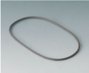
B4708920 Dichtung S