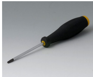
A0399T08 Torx Schraubendreher T8

Technische Änderungen vorbehalten. © OKW Gehäusesysteme, Buchen/Deutschland.