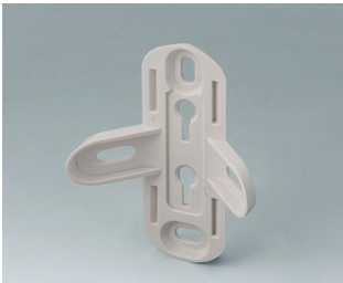
B4705907 Wandhalter ASA+PC-FR (UL 94 V-0)