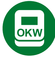
Bedruckung / Laserbeschriftung