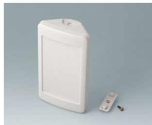
B4608207 SMART-CONTROL S, Ausf. II ASA+PC-FR (UL 94 V-0) grauweiß RAL 9002 142x81x46mm IP 55 opt., IP 40