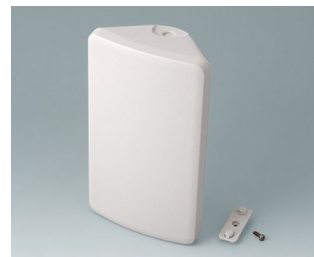
B4610107 SMART-CONTROL M, Ausf. I ASA+PC-FR (UL 94 V-0) grauweiß RAL 9002 173x101x59mm IP 55 opt., IP 40