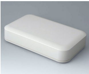
A9481107 EVOTEC 250, Ausf. I ASA+PC (UL 94 V-0) grauweiß RAL 9002 250x155x54mm IP 65 opt., IP 40