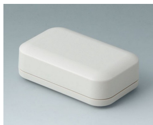
A9403107 EVOTEC 80, Ausf. I ASA+PC (UL 94 V-0) grauweiß RAL 9002 80x50x26mm IP 65 opt., IP 40