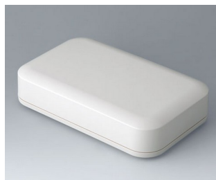
A9461107 EVOTEC 200, Ausf. I ASA+PC (UL 94 V-0) grauweiß RAL 9002 200x124x45mm IP 65 opt., IP 40