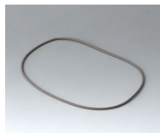
A9503030 Dichtung 125