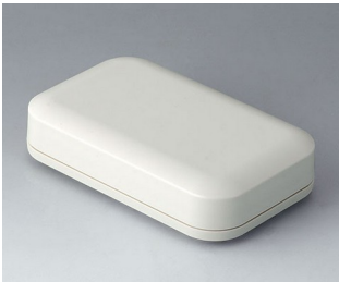
A9431107 EVOTEC 125, Ausf. I ASA+PC (UL 94 V-0) grauweiß RAL 9002 125x78x30mm IP 65 opt., IP 40