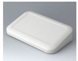
A9466107 EVOTEC 200, Ausf. III ASA+PC (UL 94 V-0) grauweiß RAL 9002 200x124x45mm IP 65 opt., IP 40