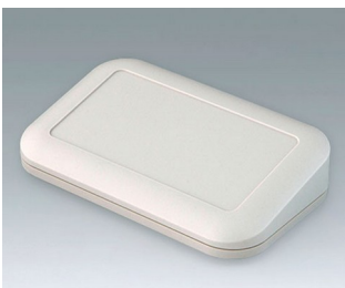
A9446107 EVOTEC 150, Ausf. III ASA+PC (UL 94 V-0) grauweiß RAL 9002 150x93x36mm IP 65 opt., IP 40