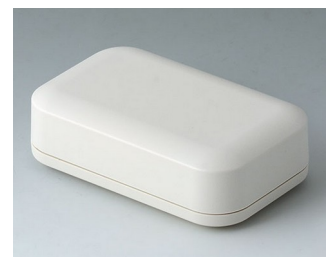
A9423107 EVOTEC 100, Ausf. I ASA+PC (UL 94 V-0) grauweiß RAL 9002 100x62x31mm IP 65 opt., IP 40