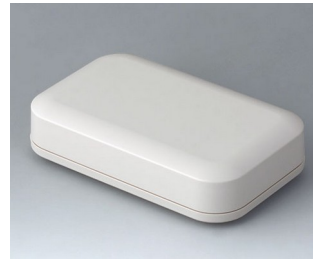
A9441107 EVOTEC 150, Ausf. I ASA+PC (UL 94 V-0) grauweiß RAL 9002 150x93x35mm IP 65 opt., IP 40