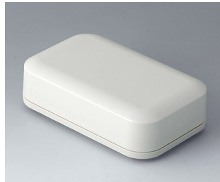
A9433107 EVOTEC 125, Ausf. I ASA+PC (UL 94 V-0) grauweiß RAL 9002 125x78x37mm IP 65 opt., IP 40