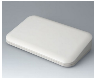
A9485107 EVOTEC 250, Ausf. II ASA+PC (UL 94 V-0) grauweiß RAL 9002 250x155x54mm IP 65 opt., IP 40