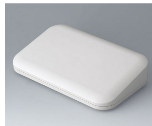
A9465107 EVOTEC 200, Ausf. II ASA+PC (UL 94 V-0) grauweiß RAL 9002 200x124x45mm IP 65 opt., IP 40