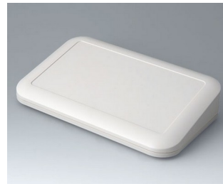
A9486107 EVOTEC 250, Ausf. III ASA+PC (UL 94 V-0) grauweiß RAL 9002 250x155x54mm IP 65 opt., IP 40