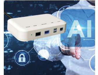
Schnittstelle für smarte Systeme