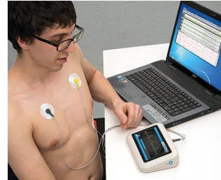
Messgerät für Vitalwerte