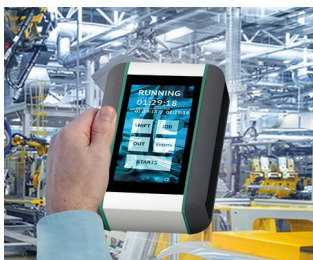
Maschinen Echtzeit- Monitoringsystem