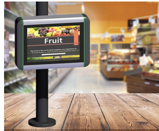
Infoterminal in Verkaufsstellen