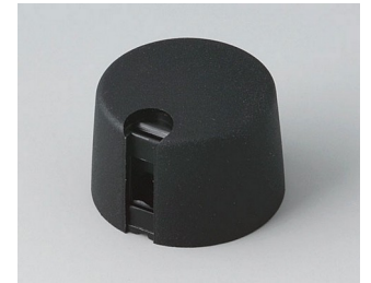
A1024049 TOP-KNOBS 24 PA 6 nero 24x16mm 4mm