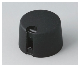
A1024069 TOP-KNOBS 24 PA 6 nero 24x16mm 6mm