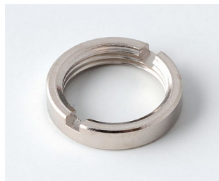
A6210009 Rundmutter M10 x 0,75