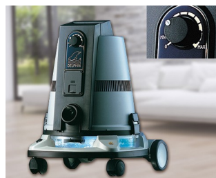
Bedienelement für einen Bodenstaubsauger