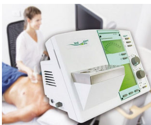
Bedienelement für ein Diagnose-Gerät

Für Drehpotentiometer mit runden Wellenenden nach DIN 41591 oder abgeflachte Wellenenden \varnothing 6/4,6 mm. Mess- und Regeltechnik, Medizin- und Labortechnik, Wellness, Health Care, Heizungs- und Klimatechnik, Kommunikation, Building, etc.