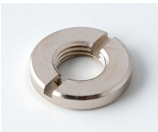
A6207009 Rundmutter M7 x 0,75