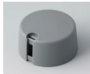
A1031048 TOP-KNOBS 31 PA 6 vulkan 31x16mm 4mm