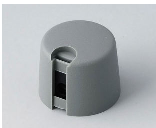
A1020068 TOP-KNOBS 20 PA 6 vulkan 20x16mm 6mm