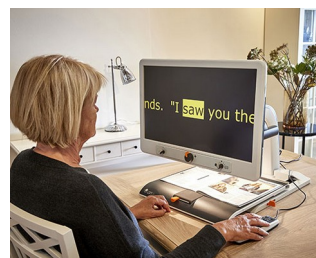
Bedienknöpfe für Bildschirmlesegerät