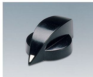
A1317860 DREHKNOPF, mit seidl. Schraubbefestigung PF schwarz RAL 9005 20,3x12,8mm 6mm