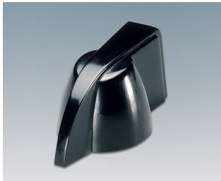
A1319860 DREHKNOPF, mit seidl. Schraubbefestigung PF schwarz RAL 9005 20,3x18mm 6mm