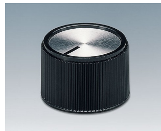
A1324260 DREHKNOPF, mit seidl. Schraubbefestigung PF schwarz/Alu 24,3x16mm 6mm