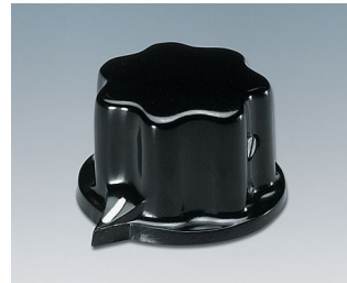
A1321060 DREHKNOPF, mit seidl. Schraubbefestigung PF schwarz RAL 9005 31x20mm 6mm