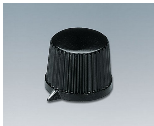
A1313560 DREHKNOPF, mit seidl. Schraubbefestigung PF schwarz RAL 9005 20x15,4mm 6mm