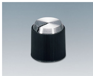
A1314240 DREHKNOPF, mit seidl. Schraubbefestigung PF schwarz/Alu 14,1x14mm 4mm