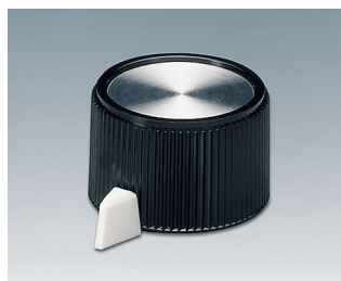
A1318560 DREHKNOPF, mit seidl. Schraubbefestigung PF schwarz/Alu 23,9x16mm 6mm