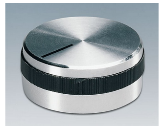
A1432469 DREHKNOPF, mit seidl. Schraubbefestigung ABS (UL 94 HB) glänzend 31,9x14mm 6mm