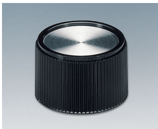
A1328160 DREHKNOPF, mit seidl. Schraubbefestigung PF schwarz/Alu 28x16mm 6mm