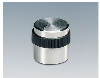
A1416449 DREHKNOPF, mit seidl. Schraubbefestigung ABS (UL 94 HB) glänzend 15,9x15mm 4mm