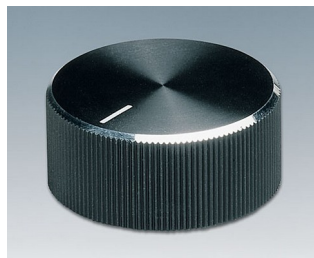
A1432260 DREHKNOPF, mit seidl. Schraubbefestigung ABS (UL 94 HB) schwarz/Alu 33x14,3mm 6mm