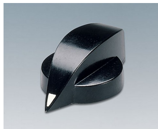
A1321860 DREHKNOPF, mit seidl. Schraubbefestigung PF schwarz RAL 9005 23x16mm 6mm