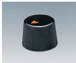
A1316240 DREHKNOPF, mit seidl. Schraubbefestigung ABS (UL 94 HB) schwarz RAL 9005 16,4x12,3mm 4mm