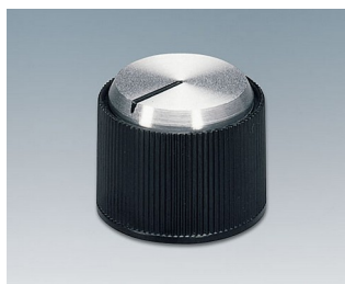
A1318260 DREHKNOPF, mit seidl. Schraubbefestigung ABS (UL 94 HB) schwarz/Alu 18,2x14,2mm 6mm