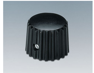
A1321160 DREHKNOPF, mit seidl. Schraubbefestigung ABS (UL 94 HB) schwarz RAL 9005 20x16mm 6mm