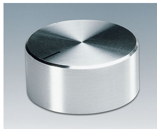
A1438461 DREHKNOPF, mit seidl. Schraubbefestigung ABS (UL 94 HB) glänzend 37,8x15,9mm 6mm