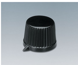
A1685540 DREHKNOPF, mit seidl. Schraubbefestigung PC schwarz RAL 9005 11,4x10,5mm 4mm