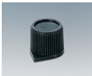
A1310560 DREHKNOPF, mit seidl. Schraubbefestigung PC schwarz RAL 9005 15,4x13,2mm 6mm