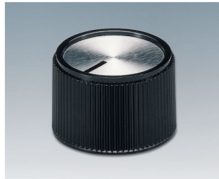
A1320260 DREHKNOPF, mit seidl. Schraubbefestigung PF schwarz/Alu 20x16mm 6mm