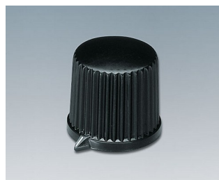
A1312560 DREHKNOPF, mit seidl. Schraubbefestigung ABS (UL 94 HB) schwarz RAL 9005 20,7x19,7mm 6mm