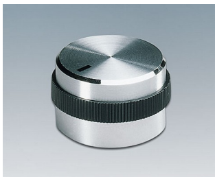
A1422469 DREHKNOPF, mit seidl. Schraubbefestigung ABS (UL 94 HB) glänzend 22,2x17,9mm 6mm