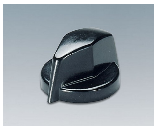
A1311860 DREHKNOPF, mit seidl. Schraubbefestigung PF schwarz RAL 9005 18,8x12,5mm 6mm