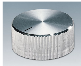
A1432261 DREHKNOPF, mit seidl. Schraubbefestigung ABS (UL 94 HB) glänzend 32,8x14,4mm 6mm