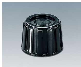
A1319260 DREHKNOPF, mit seidl. Schraubbefestigung PF schwarz RAL 9005 18,9x13,5mm 6mm