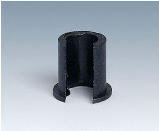
A1300040 Reduzierstück ABS (UL 94 HB) schwarz RAL 9005 7,4x7mm 4mm

Technische Änderungen vorbehalten. © OKW Gehäusesysteme, Buchen/Deutschland.