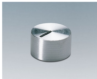
A1412441 DREHKNOPF, mit seidl. Schraubbefestigung PC glänzend 12x7,2mm 4mm