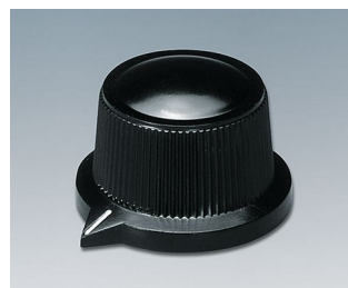
A1319560 DREHKNOPF, mit seidl. Schraubbefestigung PF schwarz RAL 9005 29x20,1mm 6mm