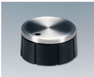
A1321260 DREHKNOPF, mit seidl. Schraubbefestigung PF schwarz/Alu 21x10mm 6mm