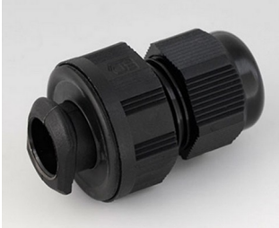
C2316719 Kabelverschraubung, M16, quick fix PA 6 schwarz RAL 9005