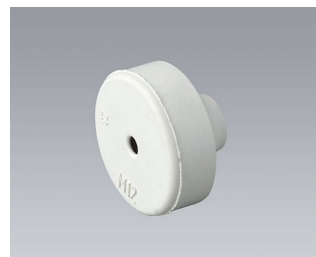
C2312137 Kabeldurchführung EPDM lichtgrau RAL 7035