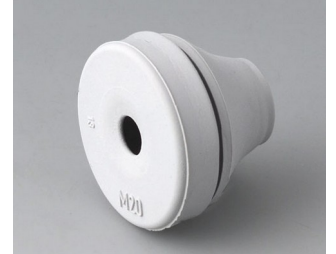
C2320137 Kabeldurchführung EPDM lichtgrau RAL 7035