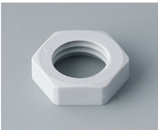
C2312117 Gegenmutter M12x1,5 PA 6 lichtgrau RAL 7035