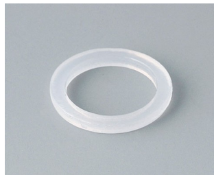
C2312126 Anschlussgewinde-Dichtring M12x1,5 PE naturfarben