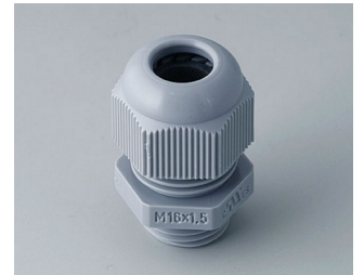
C2316418 Kabelverschraubung M16x1,5 PA 6 silbergrau RAL 7001 IP 68 opt.