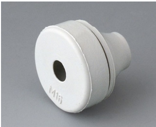
C2316137 Kabeldurchführung EPDM lichtgrau RAL 7035 IP 67