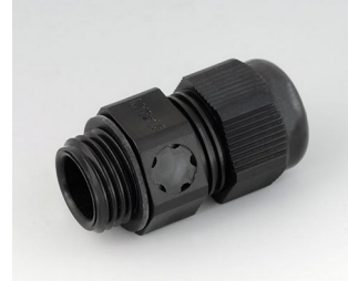
C2316919 Kabelverschraubung M16x1,5, mit Integriertem Druckausgleich PA 6 (UL 94 V-0) schwarz RAL 9005