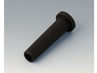
C2353849 Knickschutztülle Ø 5,3 schwarz