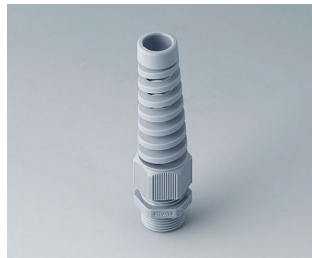
C2320518 Kabelverschraubung M20x1,5, Biegeschutz PA 6 silbergrau RAL 7001