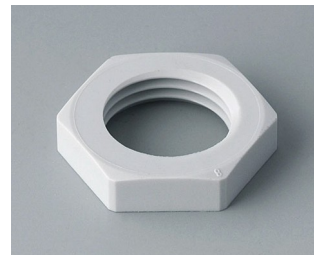
C2316117 Gegenmutter M16x1,5 PA 6 lichtgrau RAL 7035