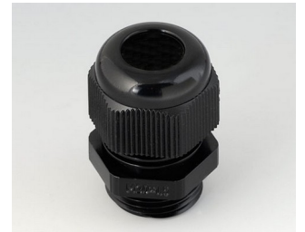
C2320419 Kabelverschraubung M20x1,5 PA 6 schwarz RAL 9005