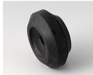
C2316159 Kabeldurchführung TPE (UL 94 V-0) schwarz RAL 9005 IP 67