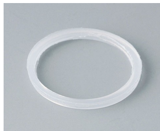
C2320126 Anschlussgewinde-Dichtring M20x1,5 PE naturfarben

Technische Änderungen vorbehalten. © OKW Gehäusesysteme, Buchen/Deutschland.