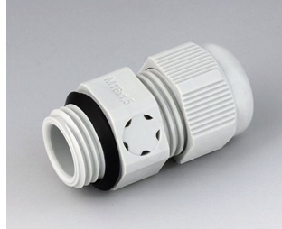
C2316917 Kabelverschraubung M16x1,5, mit Integriertem Druckausgleich PA 6 (UL 94 V-0) lichtgrau RAL 7035