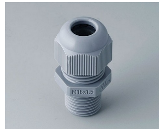
C2316618 Kabelverschraubung M16x1,5 PA 6 silbergrau RAL 7001 IP 68 opt.