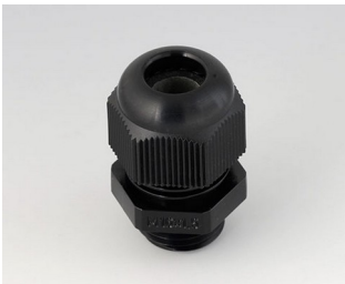
C2316419 Kabelverschraubung M16x1,5 PA 6 schwarz RAL 9005 IP 68 opt.