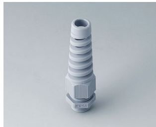
C2316518 Kabelverschraubung M16x1,5, Biegeschutz PA 6 silbergrau RAL 7001 IP 68 opt.