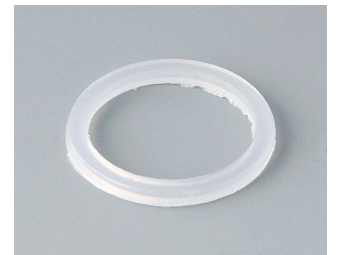
C2316126 Anschlussgewinde-Dichtring M16x1,5 PE naturfarben