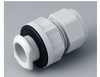
C2320717 Kabelverschraubung, M20, quick fix PA 6 lichtgrau RAL 7035