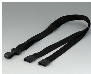
B9100073 Halsband, Textil schwarz 914x16mm