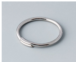
A9164001 Schlüsselring Stahl vernickelt 20,5mm