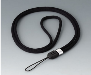
B9100063 Halsband, Textil schwarz 860mm

Technische Änderungen vorbehalten. © OKW Gehäusesysteme, Buchen/Deutschland.