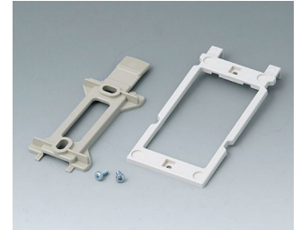
B1350048 Wandhalter-Set ABS (UL 94 HB) kieselgrau RAL 7032