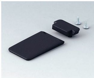
A9152059 Aufstellbügel ABS (UL 94 HB) schwarz RAL 9005