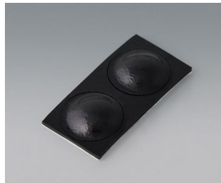
A9209229 Anti-Rutsch-Füßchen 8,5 x 2,2 mm schwarz