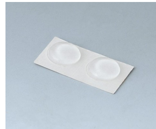
A9210180 Anti-Rutsch-Füßchen 10,1 x 1,8 mm transparent