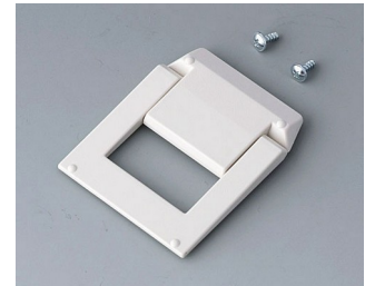
A9250817 Aufstellbügel ABS (UL 94 HB) grauweiß RAL 9002