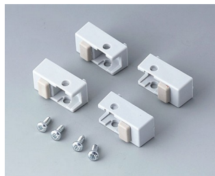
A9257105 Gehäusefüße, Ausf. I ABS (UL 94 HB) lichtgrau RAL 7035