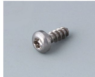
A0308132 Selbstformende Schraube 3 x 8 mm (T10) Edelstahl

Technische Änderungen vorbehalten. © OKW Gehäusesysteme, Buchen/Deutschland.