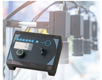
Kamera-Steuerung in der Produktion