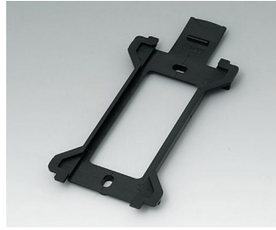
B1370029 Wandhalter für Toptec 194 ABS (UL 94 HB) schwarz RAL 9005