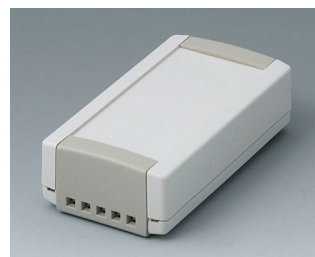
B1040465 TOPTEC 102, Ausf. II ABS (UL 94 HB) grauweiß RAL 9002 102x54x30mm IP 40