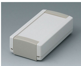
B1040365 TOPTEC 102, Ausf. I ABS (UL 94 HB) grauweiß RAL 9002 102x54x30mm IP 40