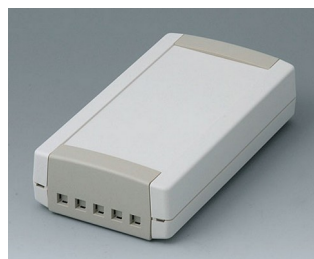
B1065465 TOPTEC 154 F, Ausf. II ABS (UL 94 HB) grauweiß RAL 9002 154x84x38mm IP 40