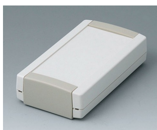
B1055365 TOPTEC 123 F, Ausf. I ABS (UL 94 HB) grauweiß RAL 9002 123x68x30mm IP 40