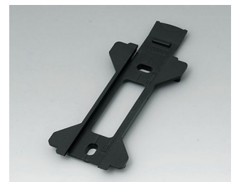
B1360029 Wandhalter für Topotec 154 ABS (UL 94 HB) schwarz RAL 9005