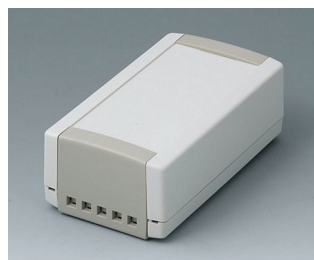
B1050465 TOPTEC 123 H, Ausf. II ABS (UL 94 HB) grauweiß RAL 9002 123x68x45mm IP 40