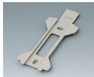
B1360028 Wandhalter für Topotec 154 PC+ABS (UL 94 V-0) kieselgrau RAL 7032