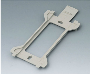
B1370028 Wandhalter für Toptec 194 PC+ABS (UL 94 V-0) kieselgrau RAL 7032