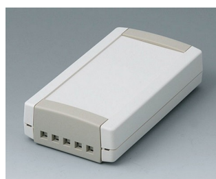
B1055465 TOPTEC 123 F, Ausf. II ABS (UL 94 HB) grauweiß RAL 9002 123x68x30mm IP 40