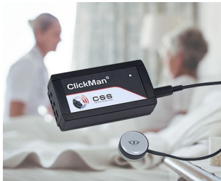
Adaptiver Multicontroller für Einfachsensoren

Universal-Gehäuse für elektronische und elektrotechnische Geräte, z.B. Überwachungstechnik als Kontrollgeräte, Signalanlagen und Steuerungen, Medizin- und Labortechnik, Computerperipherie, Automatisierung und IoT/IIoT.