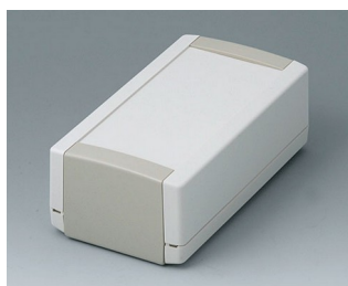
B1060365 TOPTEC 154 H, Ausf. I ABS (UL 94 HB) grauweiß RAL 9002 154x84x56mm IP 40