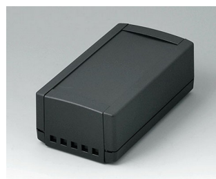
B1060469 TOPTEC 154 H, Ausf. II ABS (UL 94 HB) schwarz RAL 9005 154x84x56mm IP 40