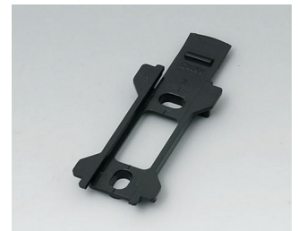
B1340029 Wandhalter für Topotec 102 ABS (UL 94 HB) schwarz RAL 9005