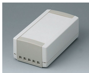
B1060465 TOPTEC 154 H, Ausf. II ABS (UL 94 HB) grauweiß RAL 9002 154x84x56mm IP 40