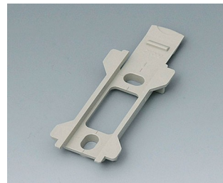
B1340028 Wandhalter für Topotec 102 PC+ABS (UL 94 V-0) kieselgrau RAL 7032