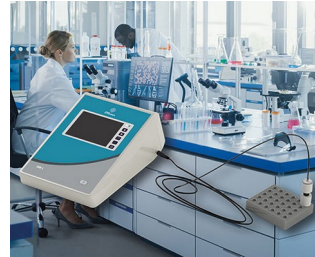
Messgerät für Labore & Forschung