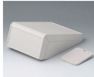
B4056227 UNITEC M, 1,4/0,6 ABS (UL 94 HB) grauweiß RAL 9002 148x210x80mm IP 40