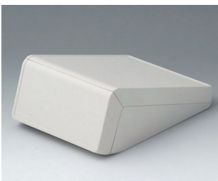
B4056107 UNITEC M, 0,6/0,6 ABS (UL 94 HB) grauweiß RAL 9002 148x210x80mm IP 40